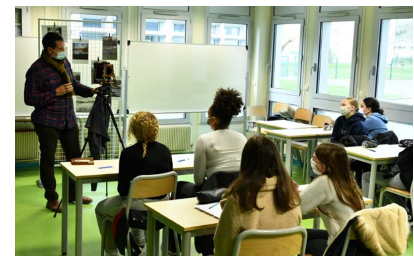
■ 12 janvier, première rencontre entre le photographe et des collégiens de Fontenay.

De janvier à avril 2021, la galerie le Carré d'Art invite le photographe catalan Israel Ariño pour un cycle d'ateliers de médiation, sur le territoire communal, à destination de deux publics : une classe de collégiens et un groupe d'adultes du club photo.