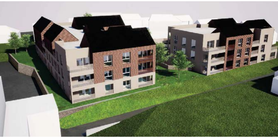
■ Projet 2/4/6 rue de Féridan, livraison prévue second semestre 2023.