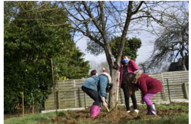
■ Nombreux ateliers proposés à l'Astrolab