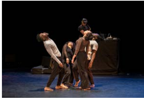
■ XY par la Compagnie Dounia - Danse & musique