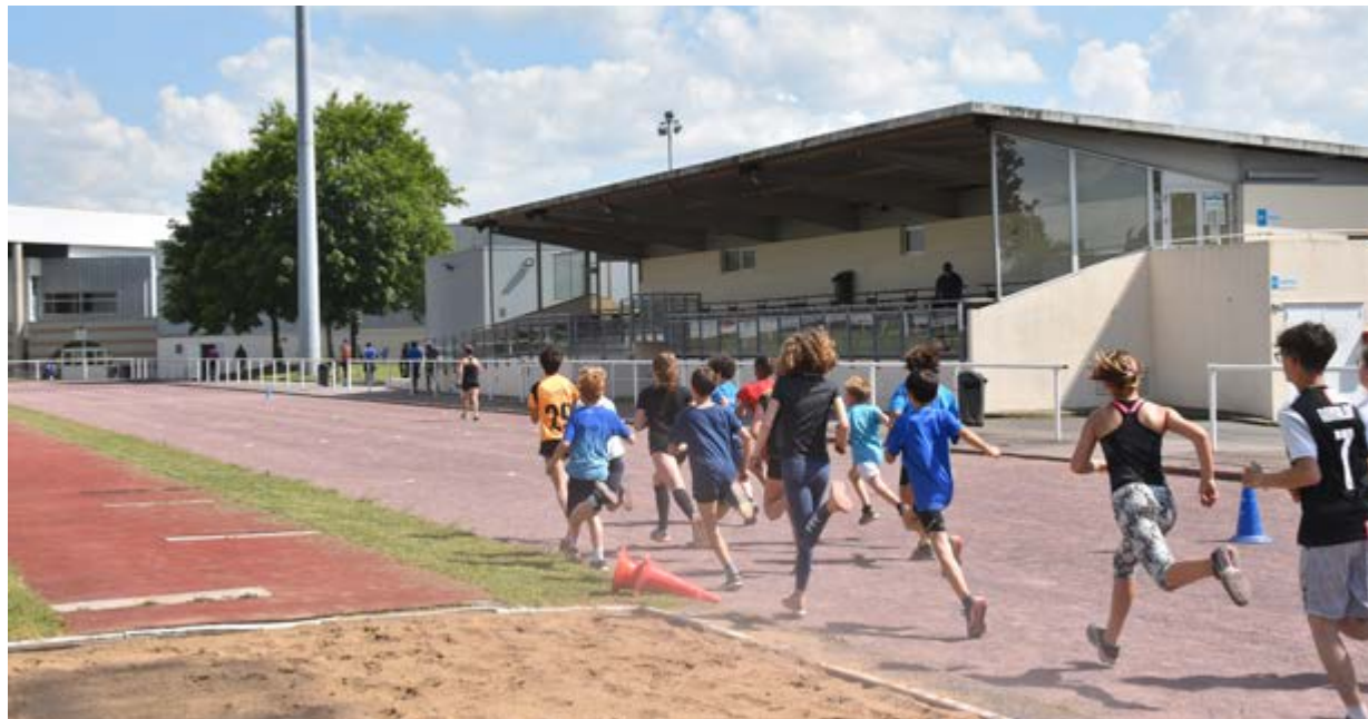
■ Les collégiens utilisent les équipements sportifs de la ville dans le cadre d'une convention.

La mise en fourrière peut intervenir lorsque des véhicules sont en infraction sur la voie publique, notamment en stationnement abusif de plus de sept jours consécutifs (article R417-12 du code de la route). C'est une façon de lutter contre l'abandon des véhicules et leur épavisation. Dès la mise en fourrière, le propriétaire du véhicule est informé par lettre recommandée avec accusé de réception. Sans réaction de la part du propriétaire, le véhicule est détruit ou vendu selon sa valeur marchande, par le service des Domaines. Une mise en fourrière ainsi que le gardiennage du véhicule coûtent actuellement 185,17 € TTC pour une voiture particulière ; les frais sont payés par la ville si le propriétaire ne se manifeste pas. Le Conseil Municipal a voté à l'unanimité la facturation au propriétaire du véhicule le coût total réglé par la ville à la fourrière.