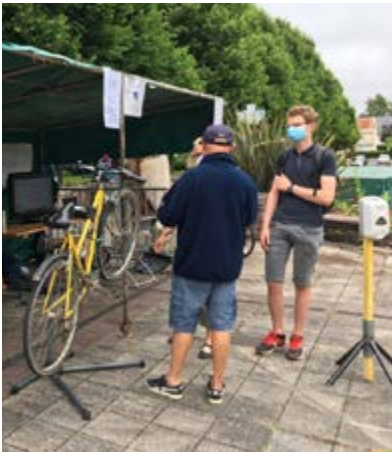
■ Atelier vélo de l'espace citoyen