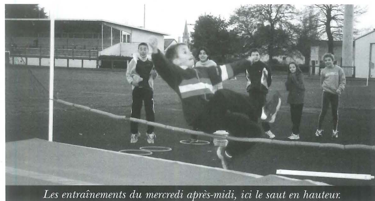
Les entraînements du mercredi après-midi, ici le saut en hauteur.