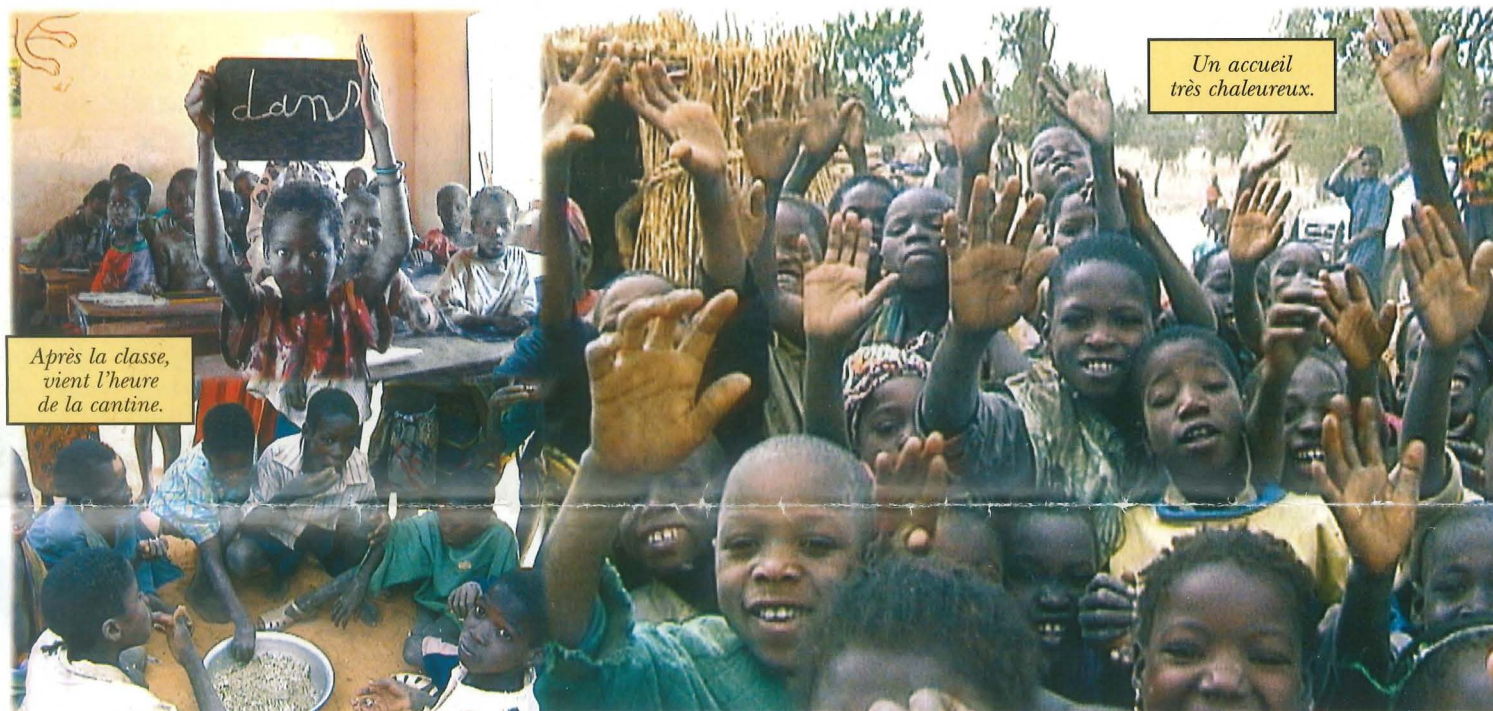
Après la classe, vient l'heure de la cantine.

Les échanges avec le Mali ne sont pas nouveaux. Déjà en 1995, le Chartrain vous relatait le voyage de 11 collégiens à Mopti. De ces relations, sont nées des amitiés et une volonté de solidarité. Les nombreuses initiatives du Club Sans Frontière du Collège et la création de l'association chartraine TERIA pour la coopération avec le Mali vont permettre la mise en place d'un chantier de jeunes. Ensemble, ils termineront les travaux d'extension et de modernisation d'une bibliothèque à Mopti.