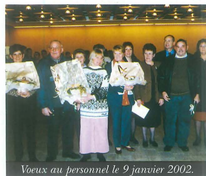
Voeux au personnel le 9 janvier 2002.