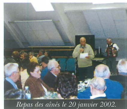
Repas des aînés le 20 janvier 2002.