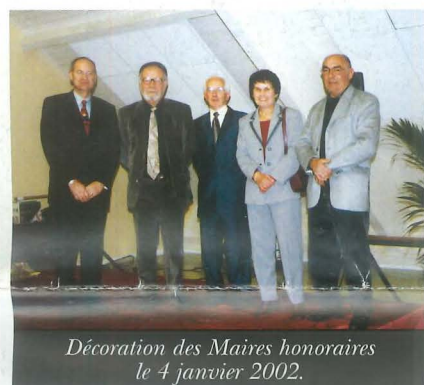
Décoration des Maires honoraires le 4 janvier 2002.