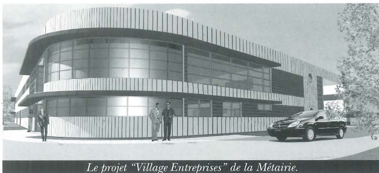
Le projet "Village Entreprises" de la Métairie.

objectifs chiffrés en terme de rejet - Réalisation d'études pour caractériser et maîtriser la pollution de la nappe phréatique - respect des délais de mise en conformité.