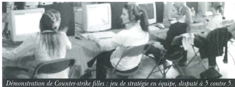
Démonstration de Counter-strike filles : jeu de stratégie en équipe, disputé à 5 contre 5.

Selon lui, on retrouve là les éléments de définition du sport en général : une activité cérébrale aussi bien que physique, un aspect compétition et une organisation répondant à des règles précises : «On peut alors comparer ces rencontres à des championnats d'échecs ou de paint-ball, selon le jeu considéré.» ajoute-t-il. Si les français considèrent toujours les jeux vidéo comme une activité enfantine, occasionnelle et parfois «abrutissante», d'autres pays comme la Corée les ont érigés en véritable institu-