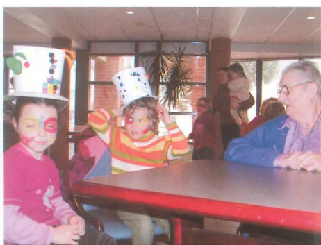
4 mars : les "clowns" du Centre de Loisirs à la Résidence de la Poterie.