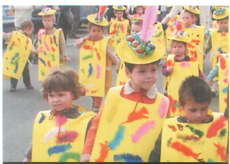
27 mars : les petits poussins de Brocéliande

Venise, Rio de Janeiro, Nice... le carnaval est une institution mondiale ! Et pourtant, il n'est pas nécessaire de vivre à Rio pour se déguiser, défiler dans les rues, danser et faire la fête. En effet, les petits Chartrains ont fait preuve d'imagination et d'esprit festif lors des carnivals de mars sur notre commune. Entre les petites fées, les masques de Zorro et autres arlequins, la couleur et la bonne humeur étaient les maîtres mots du mois dernier !