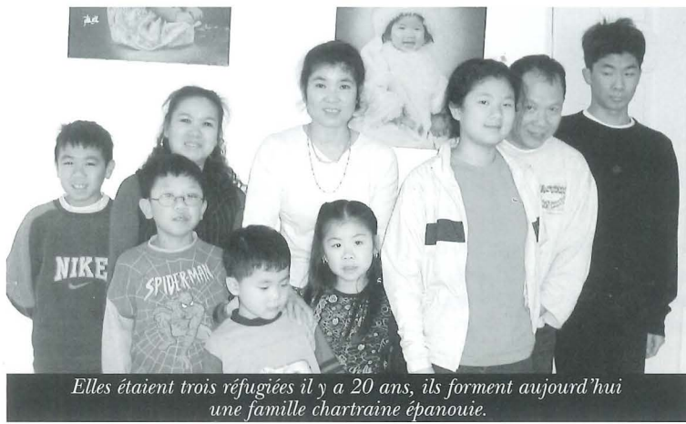
Elles étaient trois réfugiées il y a 20 ans, ils forment aujourd'hui une famille chartraine épanouie.

Pendant plusieurs années, elle travaille à Saint-Grégoire comme couturière et lui sillonne l'ouest de la France de Concarneau à Granville en passant par Sarcelles pour se forger une expérience dans la restauration. Et pourtant, la famille entière reste à Chartres : « Même si notre appartement était petit, c'était notre cocon. Les enfants