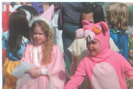
25 mars : à Sainte-Marie la panthère rose et Mélusine avaient rendez-vous.