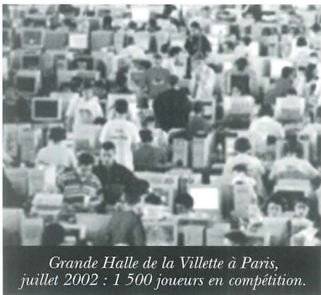
Grande Halle de la Villette à Paris, juillet 2002 : 1 500 joueurs en compétition.