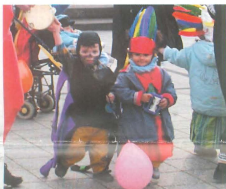
11 mars : Tintinabulle et Mille-Pattes réunis pour une balade déguisée.