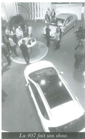
La 407 fait son show.

Projecteur sur la 407... Le groupe PSA a mis en place un système de production conçu sur le concept de plate-forme commune. Celle de la Janais correspond aux modèles haut de gamme. En effet, toutes les pièces qui composent l'armature intérieure des véhicules sortant