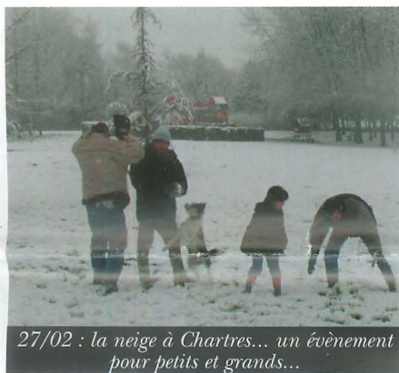
27/02 : la neige à Chartres... un événement pour petits et grands...