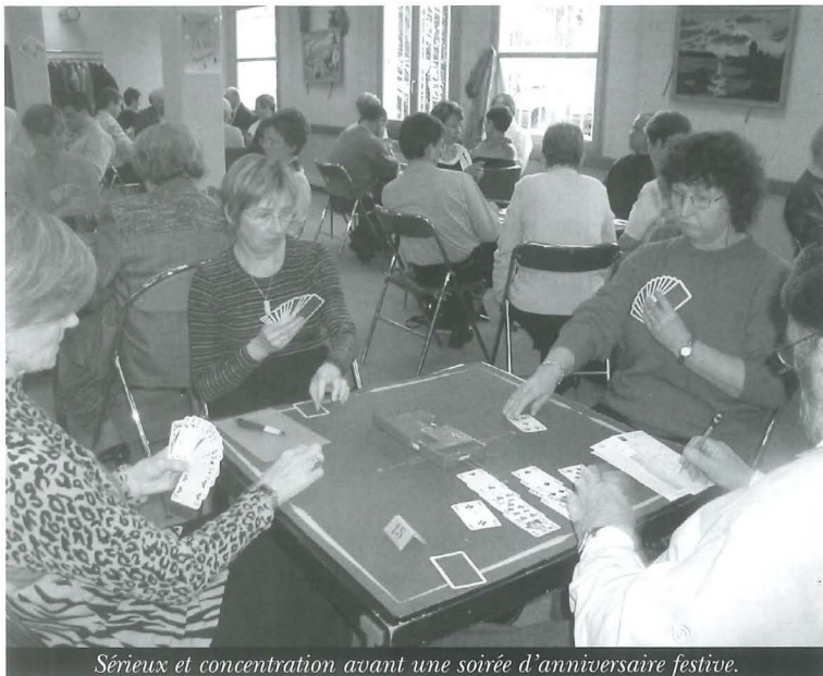
Sérieux et concentration avant une soirée d'anniversaire festive.