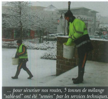
... pour sécuriser nos routes, 5 tonnes de mélange "sable-sel" ont été "semées" par les services techniques.