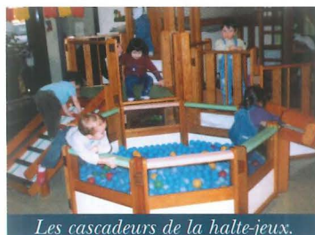
Les cascadeurs de la halte-jeux.

Quel bonheur de "patauger" dans la piscine de balles multicolores, de confectionner un bonhomme en pâte à modeler ou encore de mimer des comptines avec