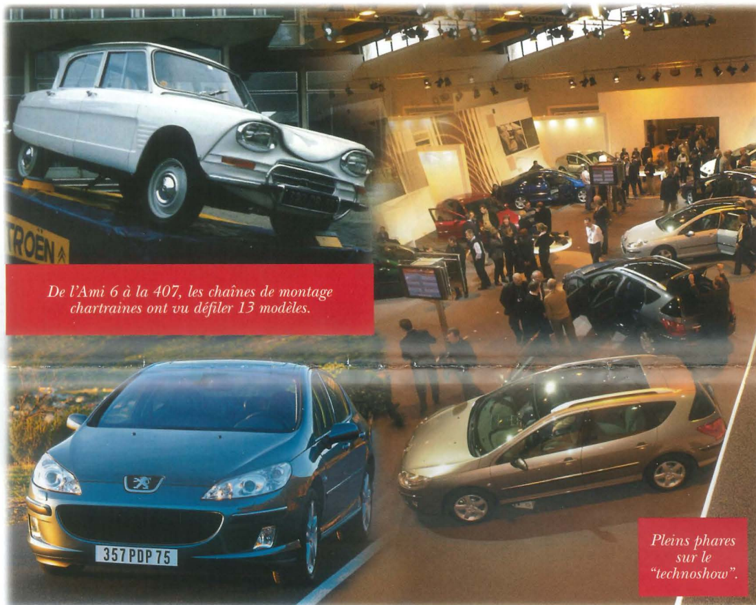
De l'Ami 6 à la 407, les chaînes de montage chartraines ont vu défiler 13 modèles.

Sur le territoire de la marque aux chevrons (Citroën), une ère nouvelle s'ouvre avec la production de la dernière née de la marque au lion (Peugeot). Les savoir-faire de PSA et de ses partenaires se sont conjugués pour concevoir une nouvelle berline européenne à l'allure sportive et féline : la 407 ! Grâce à l'éclairage d'Hervé HACHARD, Directeur de la communication et des relations extérieures de PSA, voyons quels moyens ont été mis en œuvre pour sa conception et comment s'organise la sortie commerciale d'un nouveau modèle.