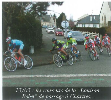
13/03 : les coureurs de la "Louison Bobet" de passage à Chartres...