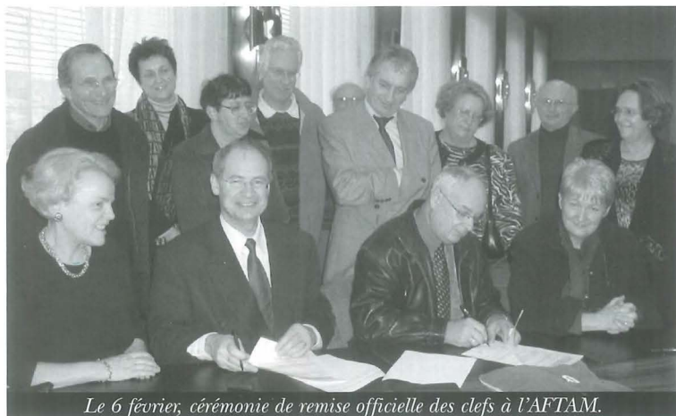
Le 6 février, cérémonie de remise officielle des clés à l'AFTAM.

Le samedi 22 novembre 2003, les communes du Canton, l'association Accueil et Formation dite AFTAM et le groupe Espacil, ont signé une convention portant sur la création d'un centre d'accueil pour demandeurs d'asile (CADA). L'objectif d'un CADA est d'assurer un hébergement et un suivi social adaptés aux personnes relevant de la demande d'asile.