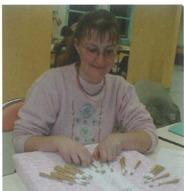
Doigts de fée pour dentelle fine.

Créée en 1978 par une poignée d'amies férues d'activités de création, l'association compte aujourd'hui 110 adhérents. En 25 années de fonctionnement les activités ont évolué et se sont diversifiées. En effet, si les adeptes de l'art floral, du patchwork ou de la peinture sur soie sont des habitués depuis des années, d'autres adhérents s'essayent à la dentelle au fuseau ou à la couture (confection vêtements), deux nouvelles activités de Chartres Accueil Loisirs. L'atelier "encadrement" existe depuis 5 ans et face à la demande croissante, 2 autres ont été ouverts en 2003. Ainsi, 8 activités sont proposées le lundi et le jeudi après-midi, le jeudi soir et le samedi matin. L'objectif principal de l'association reste l'apprentissage de techniques et de savoir-