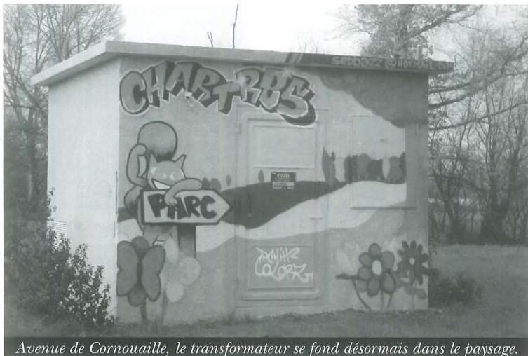
Avenue de Cornouaille, le transformateur se fond désormais dans le paysage.

Quelques bombes de couleurs, un soupçon d'imagination, des murs vierges et aussitôt l'environnement urbain change d'image. C'est dans cet esprit, que le Pôle Sud avait travaillé avec