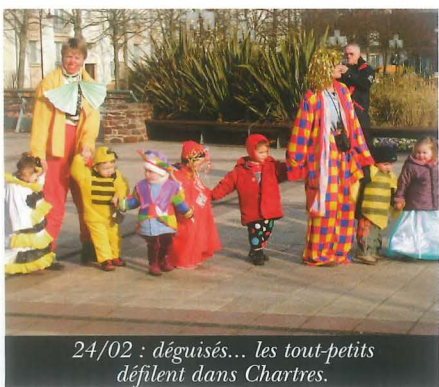
24/02 : déguisés... les tout-petits défilent dans Chartres.