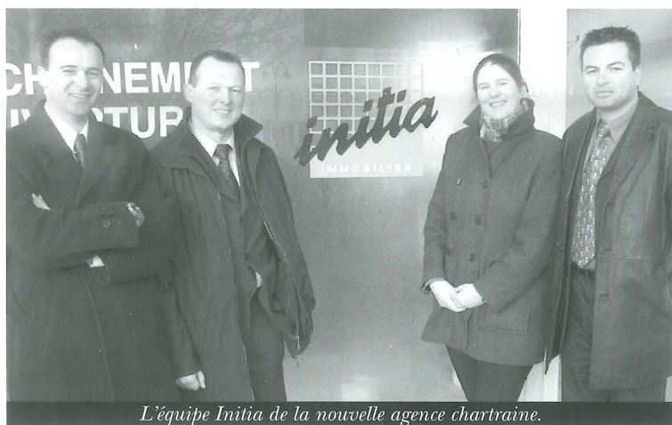
L'équipe Initia de la nouvelle agence chartreuse.

En juin 2001, le groupe immobilier aborde le bassin rennais et y crée une première agence. Après Rennes et Saint-Jacques-de-La Lande, le groupe s'implante à Chartres de Bretagne début avril 2004. Installée dans les anciens locaux de la bijouterie Cotton au centre