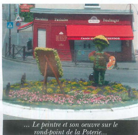
... Le peintre et son oeuvre sur le rond-point de la Poterie...