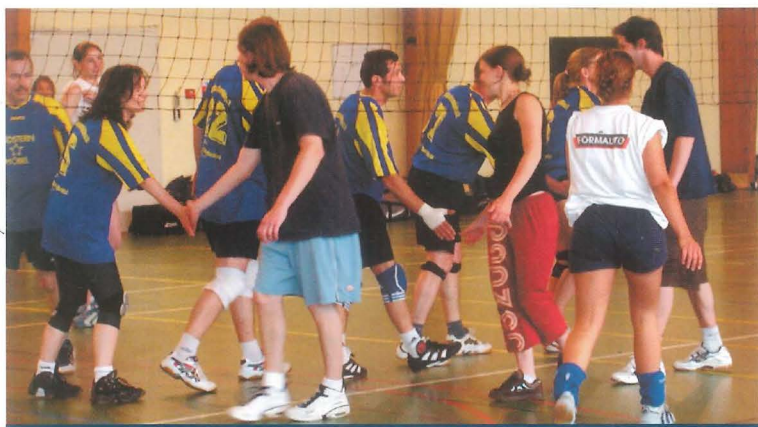
Volley-ball : fin de match amical entre Chartrains et Allemands.