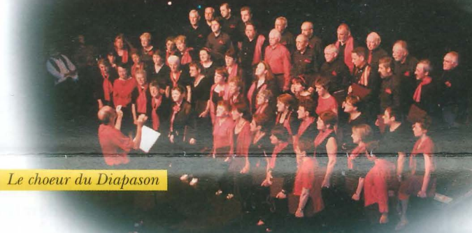
Le chœur du Diapason