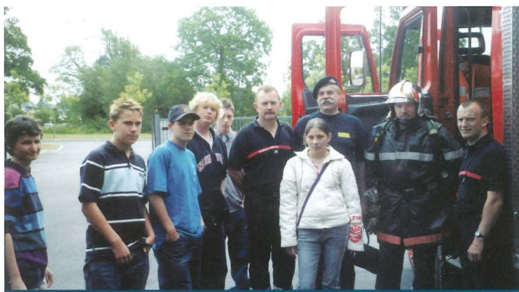
Découverte de la caserne des pompiers.

Après un exposé sur le thème « La reconquête de l'eau en Bretagne », de jeunes Chartrains ont présenté, non sans fierté, le fonctionnement du Conseil Municipal des Jeunes. La journée du dimanche a permis des échanges franco-allemands riches et conviviaux : cérémonie officielle en Mairie, concert de l'Orchestre de Chartres de Bretagne, visite de la caserne des sapeurs pompiers, tournoi de volley-ball... Au cours d'un repas en commun dans la salle Rabelais du Pôle Sud, la Présidente