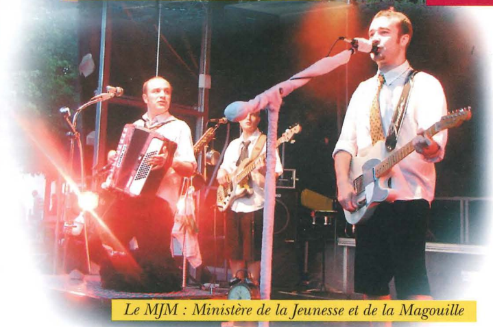
Le MJM : Ministère de la Jeunesse et de la Magouille