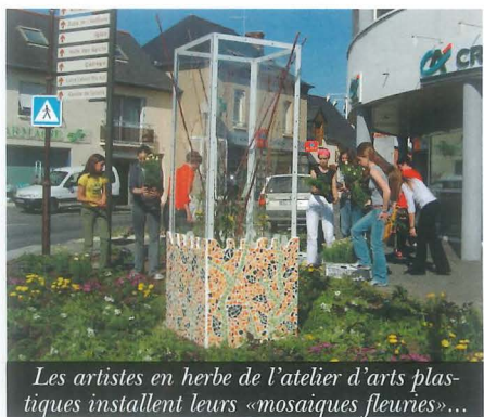
Les artistes en herbe de l'atelier d'arts plastiques installent leurs «mosaïques fleuries»...