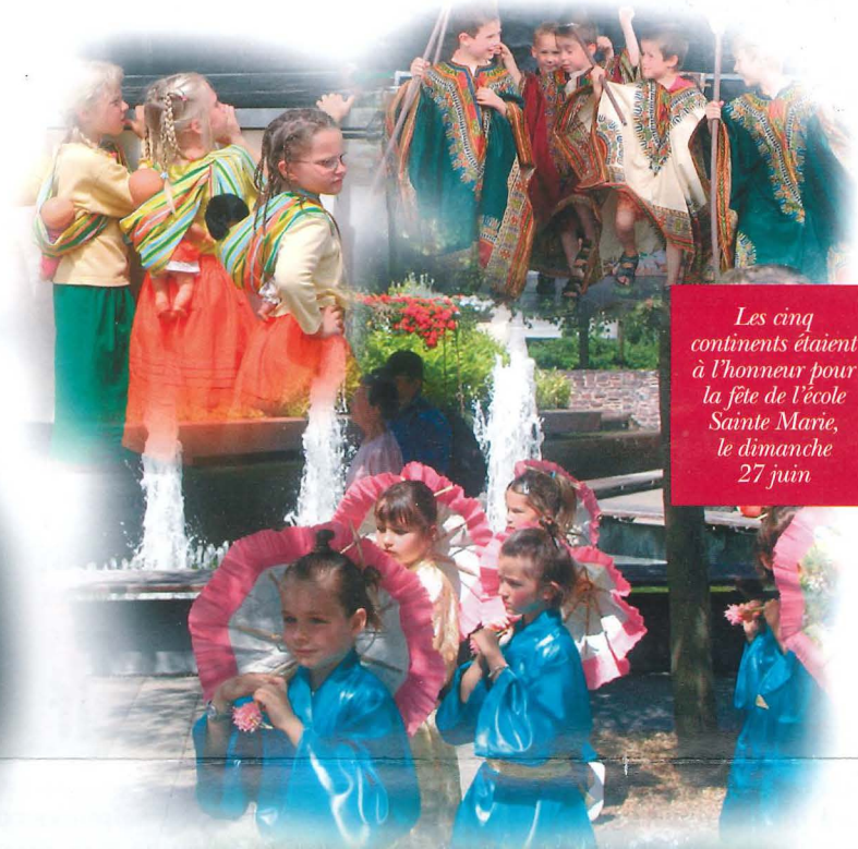
Les cinq continents étaient à l'honneur pour la fête de l'école Sainte Marie, le dimanche 27 juin