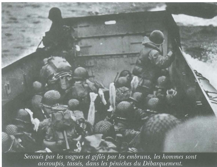
Secoués par les vagues et giflés par les embruns, les hommes sont accroupis, tassés, dans les péniches du Débarquement.