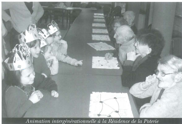
Animation intergénérationnelle à la Résidence de la Poterie

La canicule de l'été 2003 laisse un mauvais souvenir. Si rien ne peut permettre d'affirmer que celle-ci va se reproduire, des mesures importantes via le Centre Communal d'Actions Sociales (CCAS) sont applicables immédiatement. Ainsi pour la Résidence de la