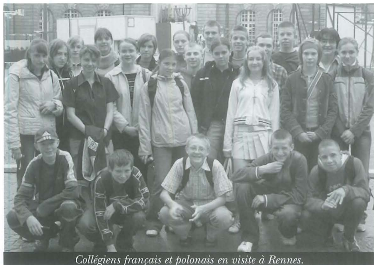
Collégiens français et polonais en visite à Rennes.

Depuis près de douze ans, la commune de Chartres-Bretagne entretient des liens d'amitié avec la Pologne grâce à un jumelage avec la ville de Lwówek. Les jeunes générations perpétuent cette coopération.