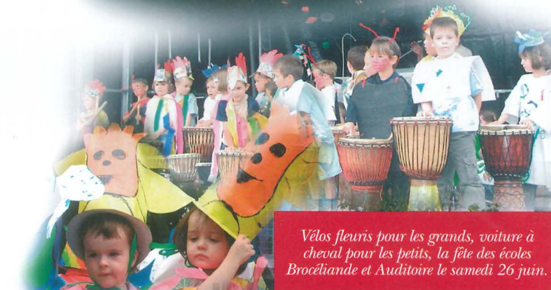
Vélos fleuris pour les grands, voiture à cheval pour les petits, la fête des écoles Brocéliande et Auditoire le samedi 26 juin.