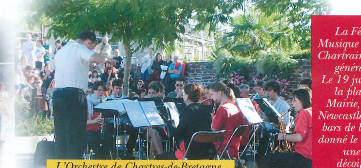
L'Orchestre de Chartres-de-Bretagne