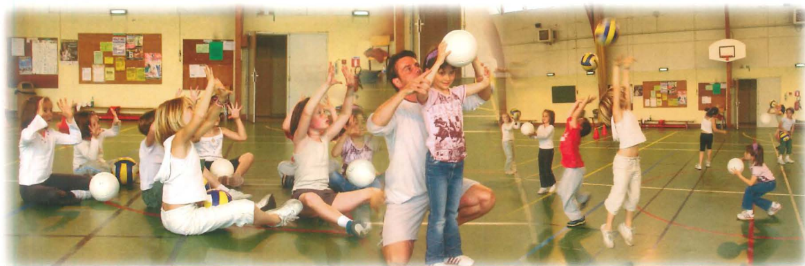
Dans chaque discipline, les gestes de base ont été enseignés par des bénévoles des associations sportives.

Quel est le point commun entre la gymnastique, le hand-ball, le badminton ou encore le volley-ball ? Toutes ces disciplines ont été abordées cette année par treize jeunes Chartrains de 6-7 ans, les samedis matins du 8 novembre 2003 au 26 juin 2004, dans le cadre de l'école multisports. À raison de trois séances d'1 heure par discipline, ils ont découvert le twirling-bâton, le football, la gymnastique, le basket-ball, le