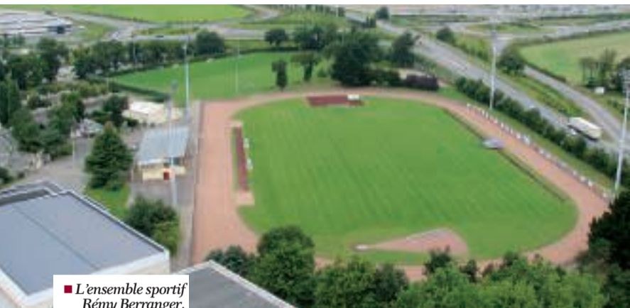
■ L'ensemble sportif Rémy Berranger.