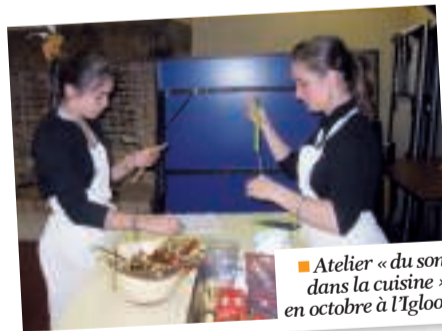
■ Atelier « du son dans la cuisine » en octobre à l'Igloo.

Les saveurs de l'automne ont parfumé l'atelier-cuisine de l'Igloo pendant les dernières vacances scolaires. Cette initiation culinaire s'ajoute aux diverses animations proposées par le centre d'animation.