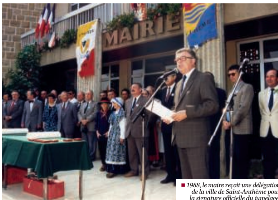
■ 1988, le maire reçoit une délégation de la ville de Saint-Anthème pour la signature officielle du jumelage.