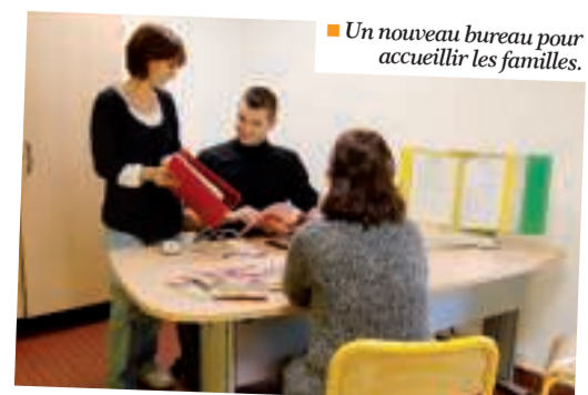
■ Un nouveau bureau pour accueillir les familles.

Les chasseurs « inuit » utilisaient l'igloo comme abri temporaire durant l'hiver ; les jeunes Chartrains y trouvent accueil et animations toute l'année.