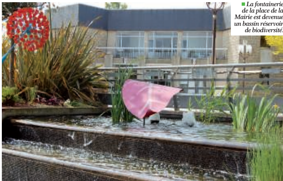
■ La fontainerie de la place de la Mairie est devenue un bassin réservoir de biodiversité.

L'eau a, en effet, un côté magique ! Elle apporte lumière, son et animation. Elle favorise aussi la vie de la faune aquatique en offrant un habitat aux grenouilles et une baignoire aux oiseaux. Les poissons donnent couleurs et mouvements,