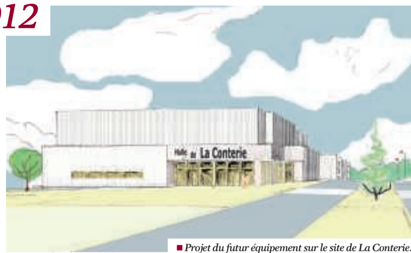
■ Projet du futur équipement sur le site de La Conterie.

Le site de La Conterie verra bientôt s'élever un nouvel espace communal, polyvalent. Le projet de halle se donne pour objectif de répondre aux besoins de manifestations sur la commune qui ne trouvent pas de réponse avec l'offre actuelle.