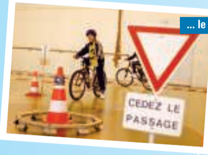
Apprentissage de la sécurité routière pour les élèves de CM2 de l'école de l'Auditoire ; séance animée par la gendarmerie.