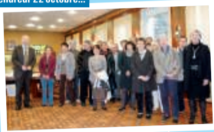
Remise des médailles du travail.