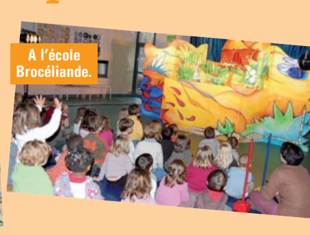
A l'école Brocéliande.