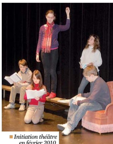
Initiation théâtre en février 2010.