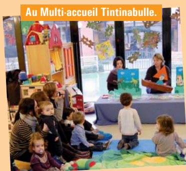
Au Multi-accueil Tintinabulle.