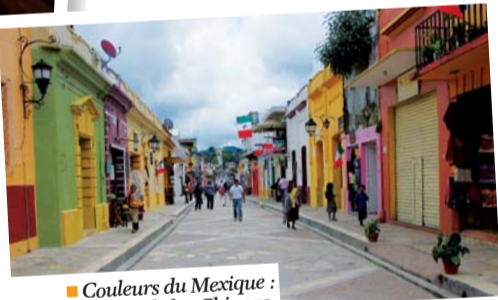
■ Coulours du Mexique : San Cristobal de las Chiapas.

Quel est le dénominateur commun entre Macao et le Mexique ? C'est Chartres de Bretagne, qui, à travers les Bourses Hélios, accompagne des jeunes de 15 à 25 ans dans leurs projets de voyage.