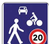
Zone de rencontre

Ils peuvent traverser où ils le souhaitent en s'assurant, bien entendu, que la voie est bien dégagée. Il convient en effet de rappeler qu'il ne s'agit pas d'un espace uniquement piéton et que ces derniers doivent toujours rester vigilants. Les voitures, vélos et bus peuvent circuler sur cette zone sans excéder une vitesse de 20 km/h.