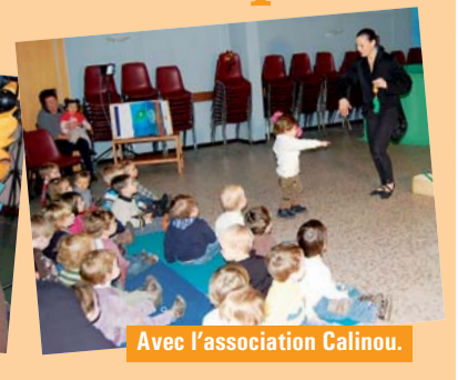
Avec l'association Calinou.