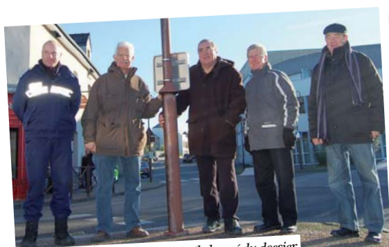
Une partie du groupe de travail chargé du dossier de sécurisation du centre-ville.

Intermédiaire entre la zone piétonne et la zone 30, une zone de rencontre est aménagée rue de Lwówek et place René Cassin. Les piétons peuvent circuler sur la chaussée et ont la priorité sur les véhicules.