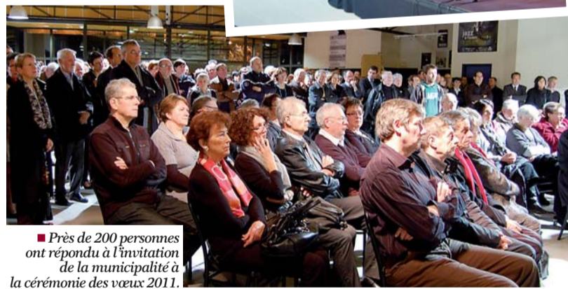
Près de 200 personnes ont répondu à l'invitation de la municipalité à la cérémonie des vœux 2011.

Parmi les importants projets en cours, le maire a également évoqué la Zone d'Aménagement Concertée Sud : l'éco-quartier des Portes de la Seiche, qui va entrer dans sa phase opérationnelle : « Face à l'urgence sociale, c'est un projet prioritaire dans le champ du logement. Produire de nouveaux logements en période de crise de l'emploi, c'est de toute évidence soutenir une activité économique locale stratégique. Ce sont nos jeunes qui feront vivre nos territoires. Il nous importe par conséquent qu'ils y soient présents dès aujourd'hui, dans un environnement de qualité et durable. »