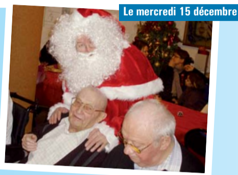
Le mercredi 15 décembre Repas de Noël animé pour les résidents de l'EHPAD.