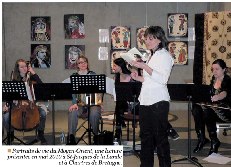
Portraits de vie du Moyen-Orient, une lecture présentée en mai 2010 à St-Jacques de la Lande et à Chartres de Bretagne.

Depuis plusieurs années, la compagnie Staccato multiplie les interventions sur la commune auprès de tous les publics. Après trois semaines en résidence de création, elle présentera son nouveau spectacle Que d'espoir ! d'après Hanokh LEVIN, les 27 et 28 janvier au Pôle Sud.