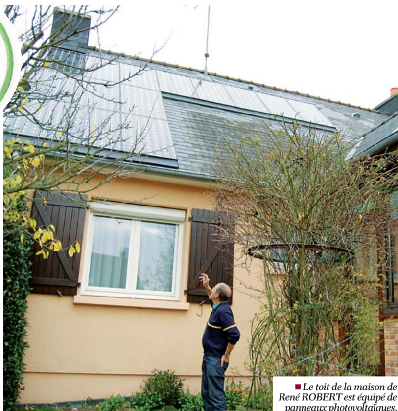
Le toit de la maison de René ROBERT est équipé de panneaux photovoltaïques.

Depuis près de 10 ans, la municipalité de Chartres de Bretagne s'est inscrite dans une démarche de développement durable avec un souci marqué pour la protection de l'environnement et une maîtrise des consommations énergétiques. Outre la commune, de plus en plus de Chartrains s'engagent dans cette démarche.