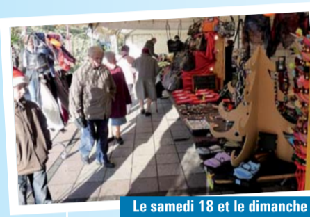
Le samedi 18 et le dimanche 19 décembre Le village de Noël du Comité des Fêtes.