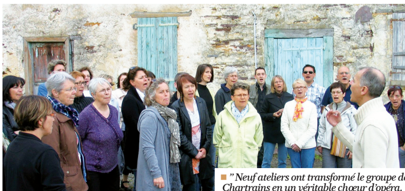
"Neuf ateliers ont transformé le groupe de Chartrains en un véritable chœur d'opéra."

Lundi 30 mai, place de la Mairie, à partir de 21h, "l'entrée" est libre.