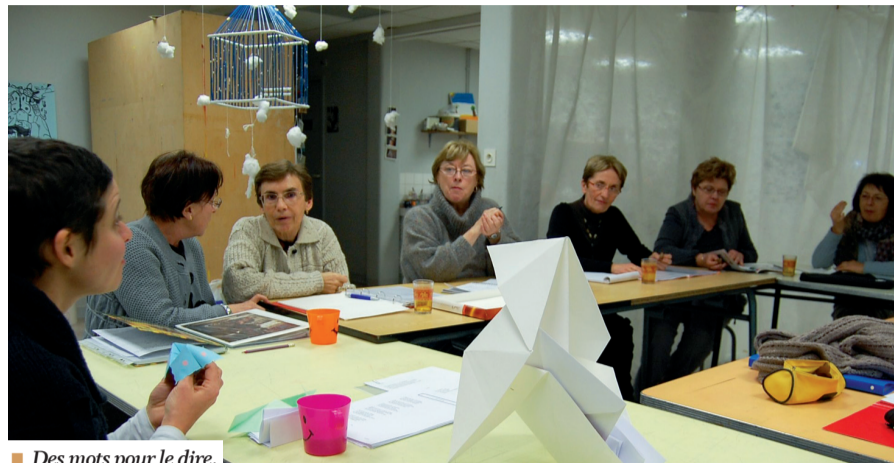
■ Des mots pour le dire.

Dans une boîte, glissez les textes imaginés par les adhérents d'une association d'écriture, ajouter les voix des choristes d'un ensemble vocal, saupoudrez du talent de deux artistes auteur, compositeur et interprète... Secouez bien ! Vous obtiendrez une création originale et unique initiée par le centre culturel Pôle Sud. Un spectacle présenté le 17 mai prochain qui promet un moment magique autour de la musique.