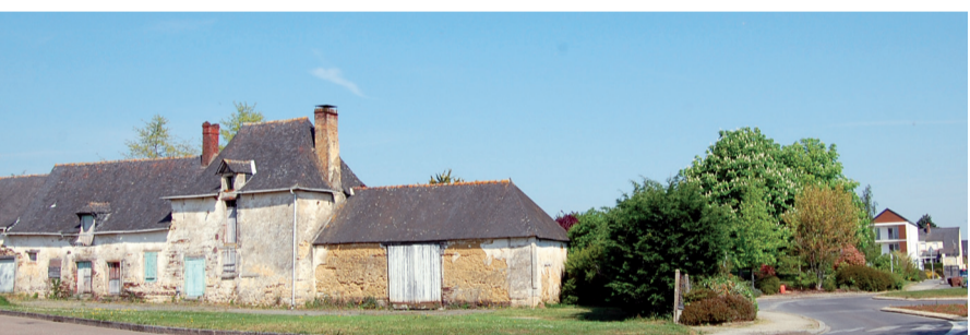
■ La ferme de la Marionnais sera réhabilitée dans le cadre du renouvellement urbain.

Malgré la faible superficie de Chartres de Bretagne, la poursuite du développement urbain s'avère nécessaire pour répondre aux enjeux identifiés lors de la révision du Plan Local d'Urbanisme approuvée le 29 juin 2009.