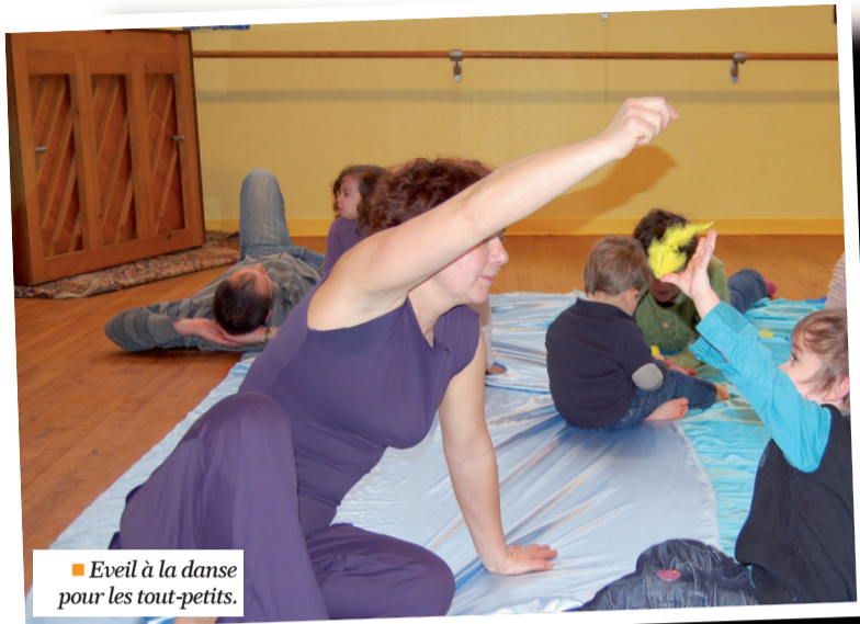
■ Eveil à la danse pour les tout-petits.