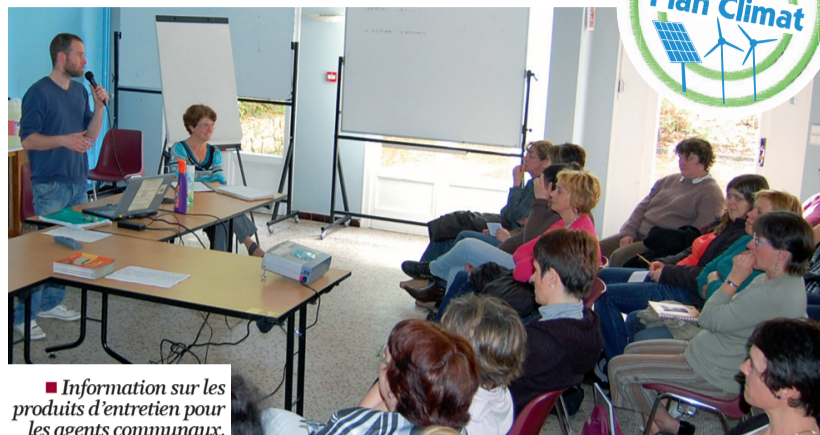
■ Information sur les produits d'entretien pour les agents communaux.

Par ailleurs, des appareils de dosage pour limiter les quantités consommées sont déjà utilisés dans plusieurs établissements comme les écoles ou le restaurant municipal. Pour d'autres équipements, des solutions restent à trouver : " Par exemple à l'EHPAD, nous devons assurer une désinfection totale. Or, les