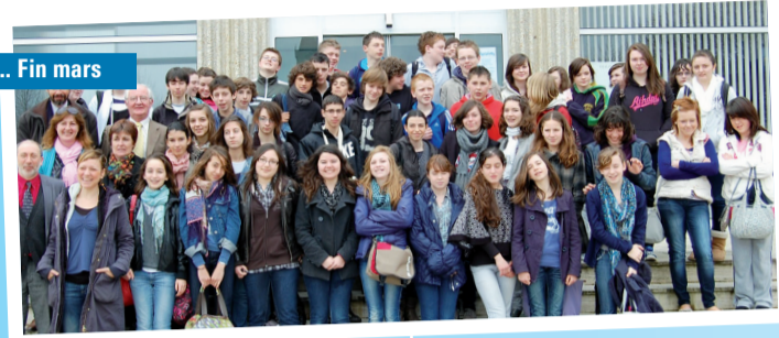
... Fin mars

Fin mars, des élèves de Rathkeal en Irlande ont séjourné chez leurs correspondants du collège de Fontenay.