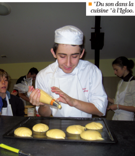
■ "Du son dans la cuisine" à l'Igloo.

La réunion du comité de pilotage du 5 avril offrait, entre autres, l'occasion de présenter les nouvelles actions qui ont vu le jour au cours des deux dernières années.