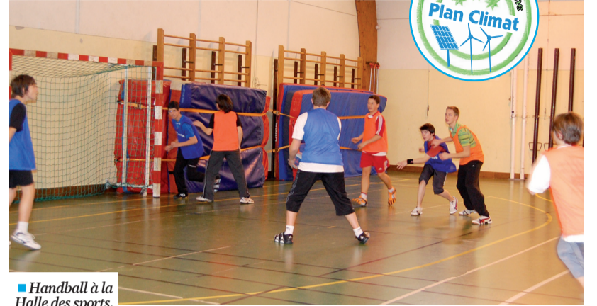
■ Handball à la Halle des sports.

Eteindre la lumière en quittant une salle, bien fermer le robinet d'eau, fermer les portes, réduire le chauffage quand les pièces ne sont pas occupées... Ces réflexes simples d'économie d'énergie paraissent bien évident chez soi ! Et pourtant, ils sont loin d'être habituels dans les lieux fréquentés par le public.