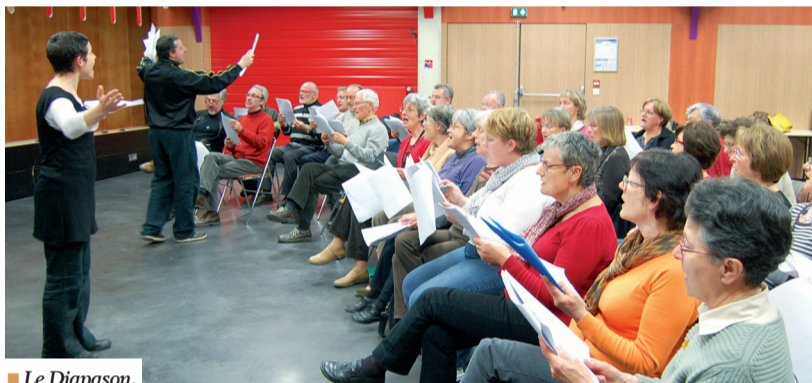
■ Le Diapason.