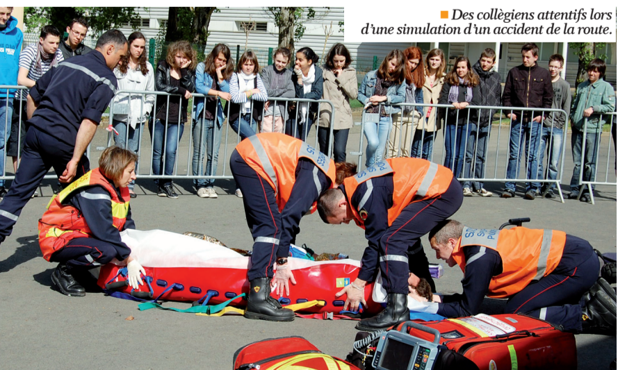
■ Des collégiens attentifs lors d'une simulation d'un accident de la route.

Les 11 et 12 avril derniers, les élèves de 4 e et de 3 e du collège chartrain ont expérimenté différents ateliers comme la présentation vidéo des risques encourus sous l'emprise de l'alcool ou le test de lunettes de simulation d'emprise alcoolique limitant le champ visuel, ou encore l'essai des simulateurs de conduite voiture et deux roues. Les pompiers du Blosne sont intervenus pour une simulation d'accident entre scooter et voiture. Outre la prévention, cette démonstration permet de rappeler les " premiers gestes de secours " qui peuvent sauver des vies. Enfin, la brigade de prévention de la délinquance juvénile a animé des ateliers sur les effets des produits stupéfiants au volant et une voiture-tonneau a permis aux élèves de vivre, de l'intérieur, une sortie de route.