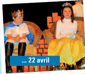
... 22 avril

Fin mars, des élèves de Rathkeal en Irlande ont séjourné chez leurs correspondants du collège de Fontenay.