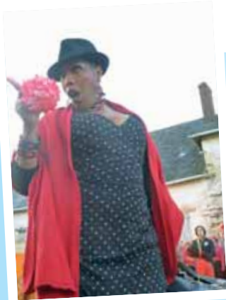
La troupe de Carmen a envahi les rues de la commune...