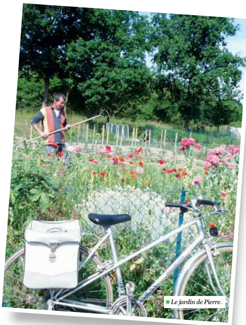
Le jardin de Pierre.

En effet, au-delà du bénéfice immédiat du potager, les jardins familiaux concourent à créer de nouveaux liens sociaux très forts, favorisant les ren-