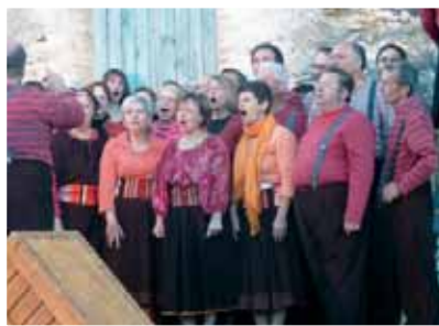
Les airs entonnés par le chœur des Chartrains ont résonné des balcons de la Marionnaise à la Mairie...