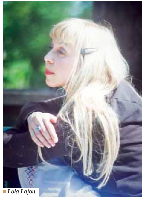
■ Lola Lafon