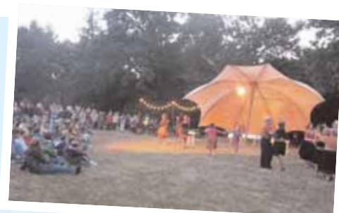
L'opéra déambulatoire a rassemblé un public nombreux et conquis !