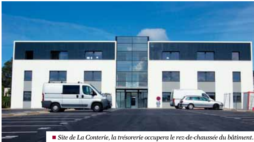
■ Site de La Conterie, la trésorerie occupera le rez-de-chaussée du bâtiment.

La commune a acquis un plateau tertiaire de 408 m 2 au rez-de-chaussée d'un immeuble construit par le groupe Launay. Celui-ci est situé à l'extrémité de l'actuelle rue Léo Lagrange. Le coût d'acquisition par la commune est de 714 181,44 € HT. Le nouveau loyer annuel supporté par l'Etat sera de 51 250 € HT.