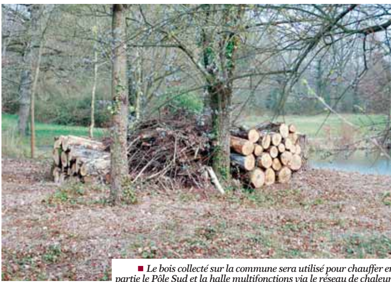
■ Le bois collecté sur la commune sera utilisé pour chauffer en partie le Pôle Sud et la halle multifonctions via le réseau de chaleur.

Extension des compétences de la communauté d'agglomération rennaise : « création et entretien des infrastructures de charge nécessaires à l'usage de véhicules électriques ou hybrides rechargeables ou mise en place d'un service comprenant la créa-