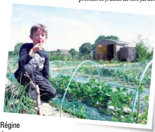
Les demandes de jardins familiaux sont à formuler par courrier à la Mairie.