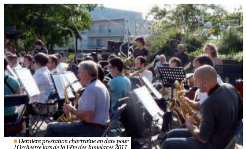
■ Dernière prestation chartraine en date pour l'Orchestre lors de la Fête des Jumelages 2011.

L'Orchestre de Chartres de Bretagne rassemble, depuis 1982, une quarantaine de musiciens amateurs de tous âges pour partager et faire partager leur plus grand plaisir : la musique ! L'un des grands rendez-vous de la formation musicale est le concert de Sainte Cécile en novembre dans la salle Jacques Brel du Centre Culturel. Tous les musiciens sont présents et déploient leurs talents. Cette année, le public a rendez-vous le samedi 19 novembre à partir de 20h30 : "Nous proposerons des musiques de films, des