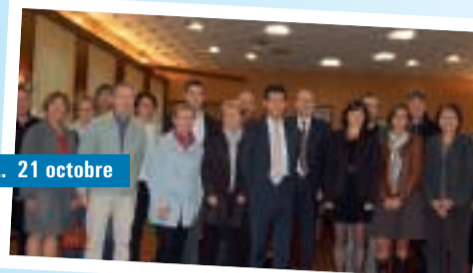
... 21 octobre

Histoire de l'accordéon à travers une surprenante exposition présentée au Pôle Sud durant "Le Grand Soufflet".