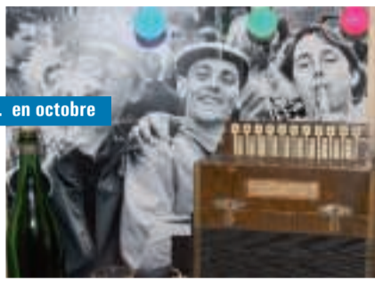
... en octobre

Visite de la délégation polonaise au Cyberspace.