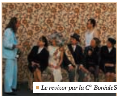
Le révizor par la C ie Boréale'S.

Mairie. 35131 Chartres de Bretagne Tél. 02 99 77 13 00 commune@ville-chartresdebretagne.fr