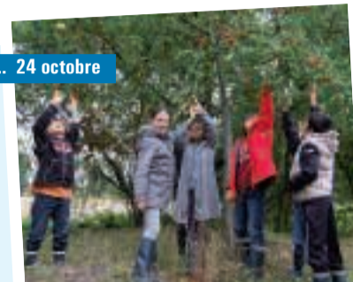
... 24 octobre

Opération cueillette de pommes lors du stage "Du son dans la cuisine" de l'Igloo.