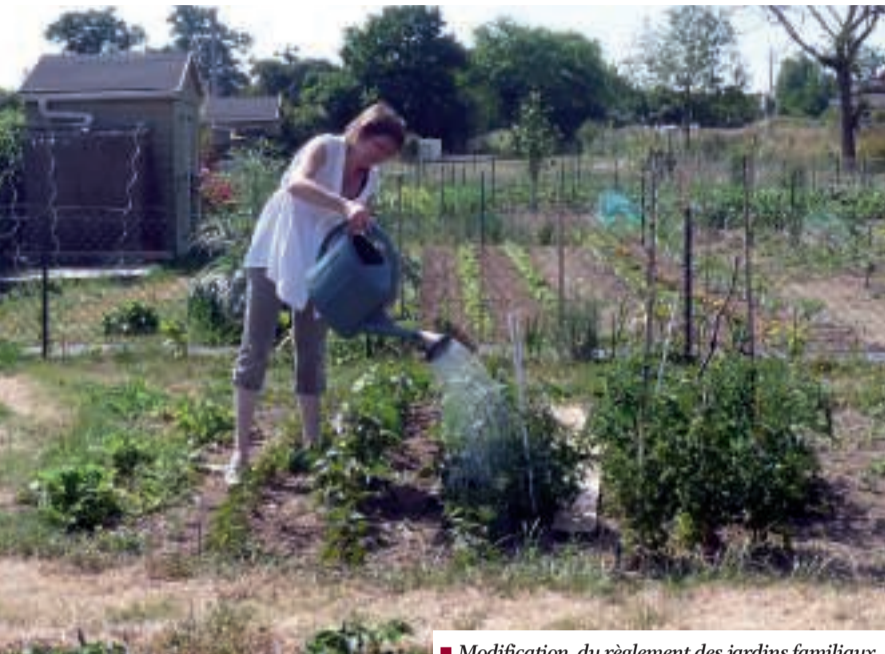
■ Modification du règlement des jardins familiaux.