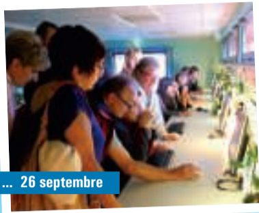
... 26 septembre

Visite de la délégation polonaise au Cyberspace.