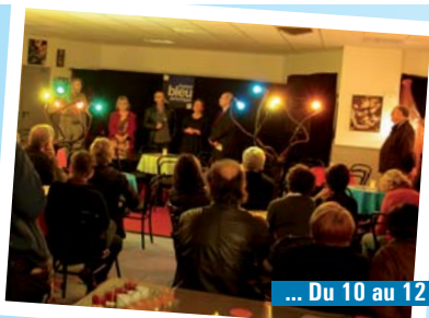
... Du 10 au 12 novembre

Commemoration du 11 novembre, des petits Chartrains fleurissent le Jardin du souvenir au cimetière.