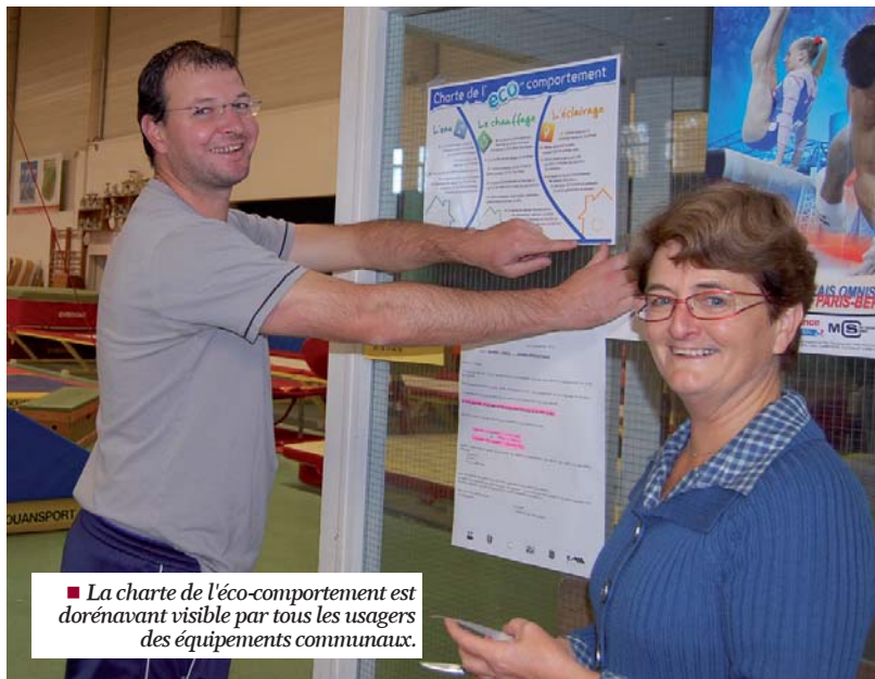
■ La charte de l'éco-comportement est dorénavant visible par tous les usagers des équipements communaux.

Cependant les modifications de comportement possibles de la part des usagers eux-mêmes ont également été largement évoquées au cours des réunions. Afin de sensibiliser les utilisateurs, une charte du bon comportement a été rédigée puis adoptée par les participants aux différentes réunions. Toutes les associations concernées ont été destinataires de la charte qui sera également affichée dans tous les bâtiments communaux fréquentés par le public, qu'il soit associatif ou scolaire.