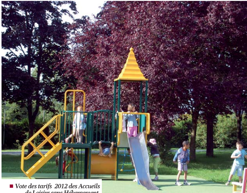
■ Vote des tarifs 2012 des Accueils de Loisirs sans Hébergement.