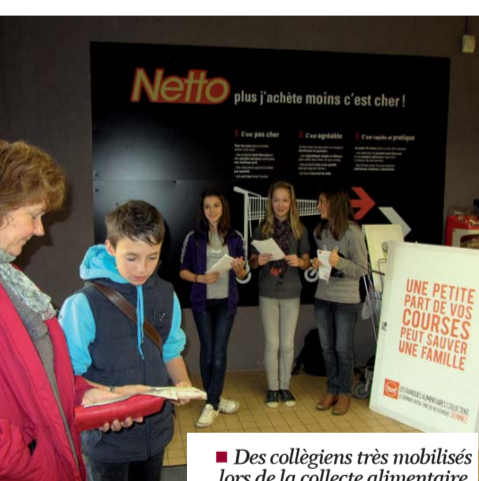
■ Des collégiens très mobilisés lors de la collecte alimentaire.

Les 25 et 26 novembre derniers avait lieu la grande collecte nationale de la banque alimentaire. Des millions de Français ont donné une petite part de leurs courses pour soutenir les plus démunis. A Chartres, près de 30 bénévoles se sont relayés à l'entrée des magasins et à l'épicerie sociale pour le tri et la mise en rayon.