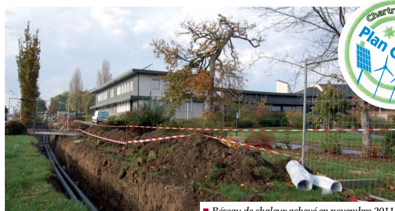
■ Réseau de chaleur achevé en novembre 2011.

La chaudière à bois de la piscine produit davantage de calories que les stricts besoins de l'équipement aquatique. Aussi, afin d'obtenir le meilleur