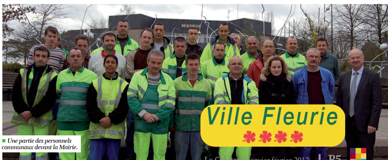
■ Une partie des personnels communaux devant la Mairie.

Si "L'Espérance en fête" a trouvé l'écho souhaité, si la ville garde cette image de ville fleurie où il fait bon vivre, c'est grâce à l'investissement et au travail de toutes les équipes communales.