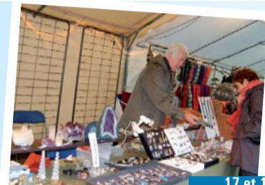
... 17 et 18 décembre

Autour de la place du 8 mai 1945, un blanc manteau et un joli décor coloré attendaient les jeunes Chartrains.