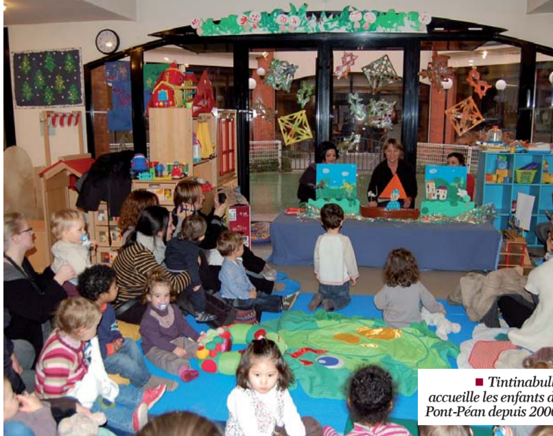
■ Tintinabulle accueille les enfants de Pont-Péan depuis 2006.

Participation financière de la CAF 35 pour l'acquisition d'un logiciel de gestion pour les accueils de loisirs, l'accueil jeunes et le multi-accueil : le Conseil municipal accepte la participation financière de la CAF d'Ille-et-Vilaine à hauteur de 3 967 € pour l'acquisition du logiciel Concerto de la société Arpège (voir page 4).