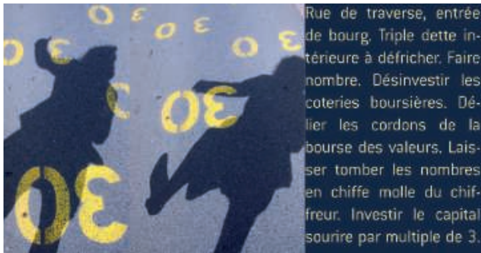
■ Extrait du travail de Christine Barbedet.