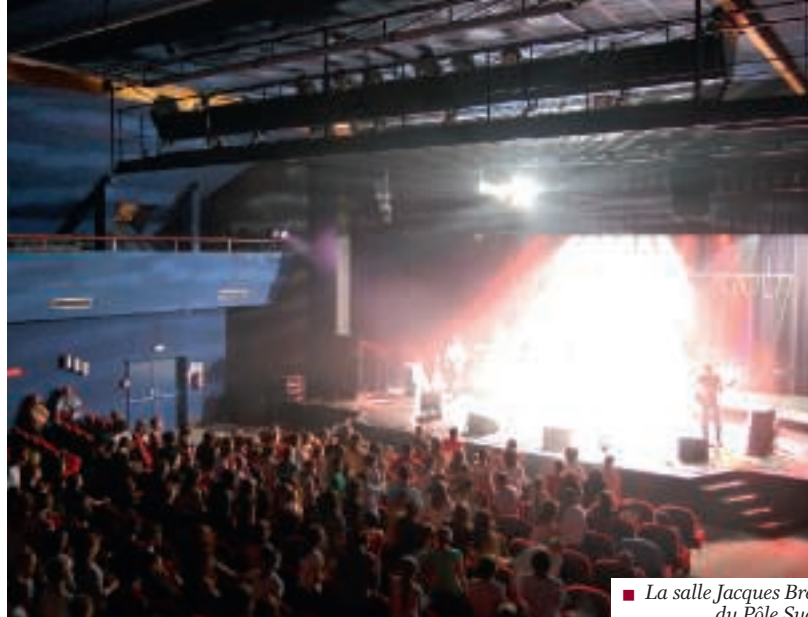
■ La salle Jacques Brel du Pôle Sud.

. Cinéma Espérance : l'association va contracter un emprunt de 60 000 € sur 10 ans pour financer le nouvel équipement de projection pour le passage au numérique. La commune va garantir cet emprunt.