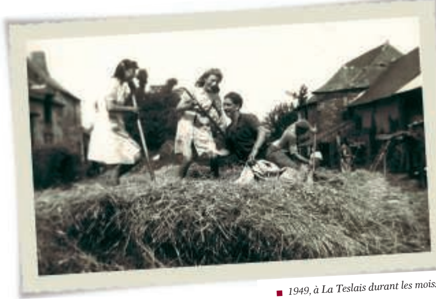
■ 1949, à La Teslais durant les moissons.