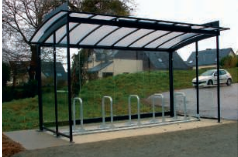
■ Modèle d'abri vélo prochainement installé dans le centre ville.