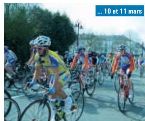
... 10 et 11 mars