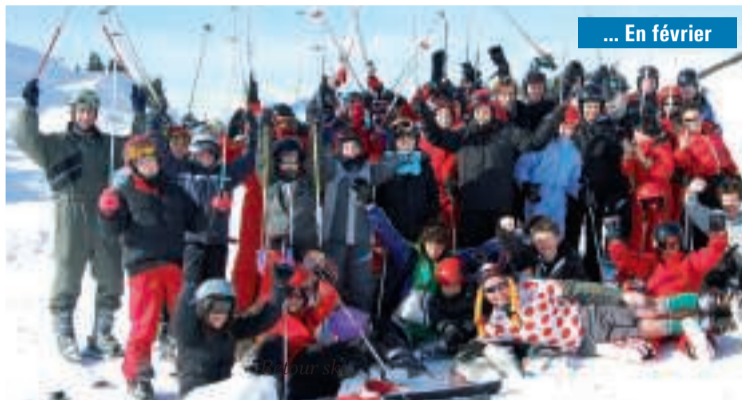
... En février