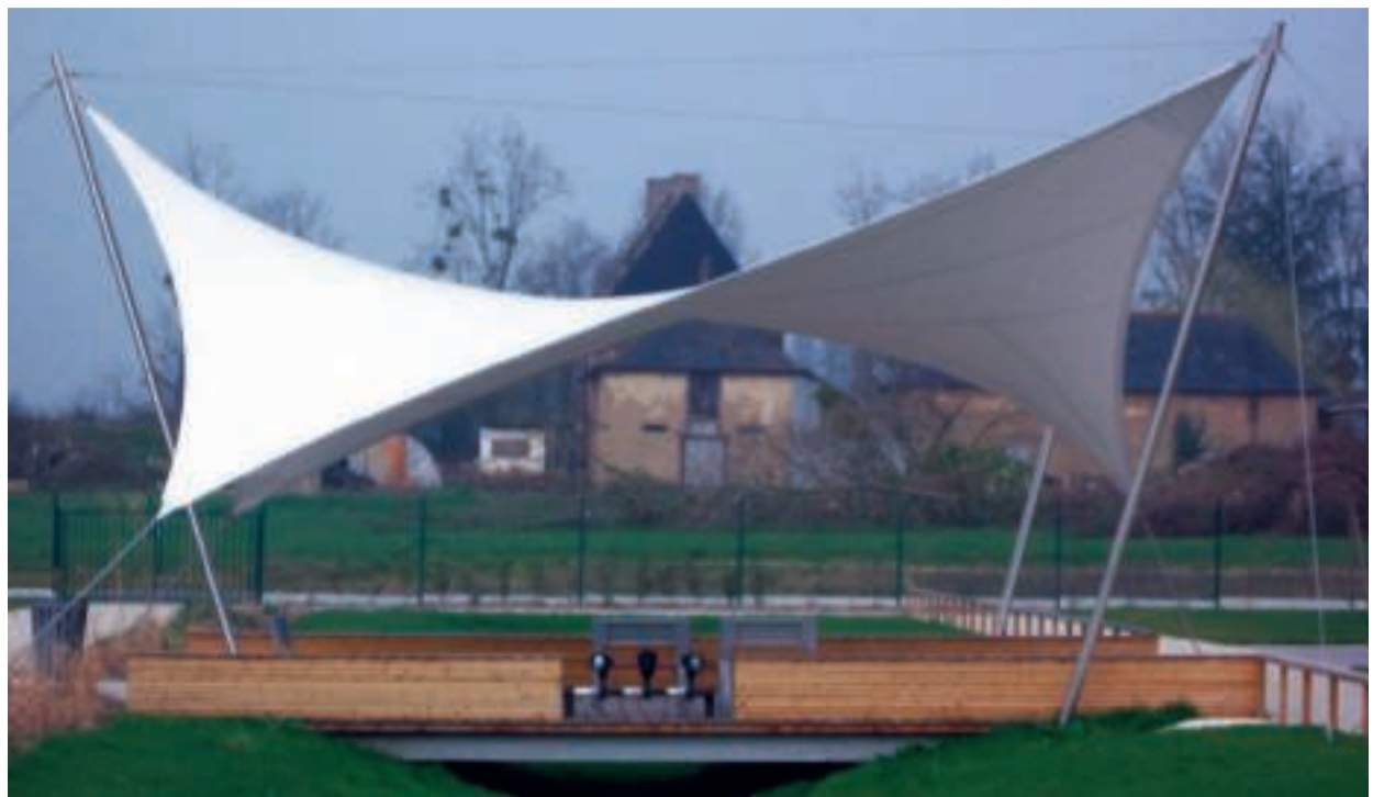
■ Bientôt, au Parc de loisirs, un kiosque du même type trouvera sa place pour des animations.

L'organisation a été confiée aux services de la ville qui reste le maître d'ouvrage. L'encadrement technique sera assuré par l'association des Compagnons Bâtisseurs Bretagne, spécialisée dans la gestion de chantiers internationaux de jeunes bénévoles. La diversité des tâches permettra aux participants de découvrir notamment, le jardinage (plantation d'arbres et d'arbustes), la petite maçonnerie, la soudure, la menuiserie... dans le cadre