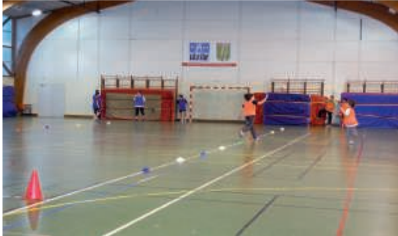
■ Dans quelques mois, la Halle des sports affichera ses nouvelles couleurs.

Les travaux de rénovation de la Halle des sports débuteront en avril prochain pour une durée d'environ 6 mois. Afin d'améliorer les conditions de pratiques sportives pour tous, ces travaux ont été annoncés bien en amont et largement préparés en concertation avec les acteurs locaux.