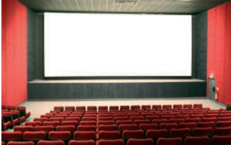
■ Le cinéma Espérance bientôt numérique.

. Réhabilitation et mise aux normes de la Halle des sports : attribution des marchés de travaux. Par délibération du 26 septembre 2011, le Conseil municipal a approuvé l'avant-projet définitif relatif à cette opération dont le montant prévisionnel des travaux est de