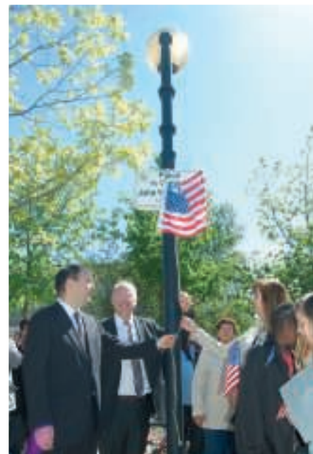
Après une lecture d'un poème de Gisèle Cogez par de jeunes collégiens de Fontenay, la plaque en l'honneur du Capitaine Dickson a été dévoilée.