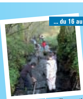
... du 16 au 20 avril...