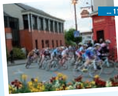
... 11 et 12 mai

Week-end festif du Comité des Fêtes avec la course cycliste Pierre Guédard"... Suivie du vide-greniers.