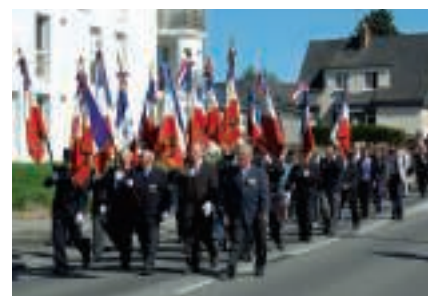
Un défilé-parade a emmené le cortège au sud de la commune, près de la rue Saint Exupéry,