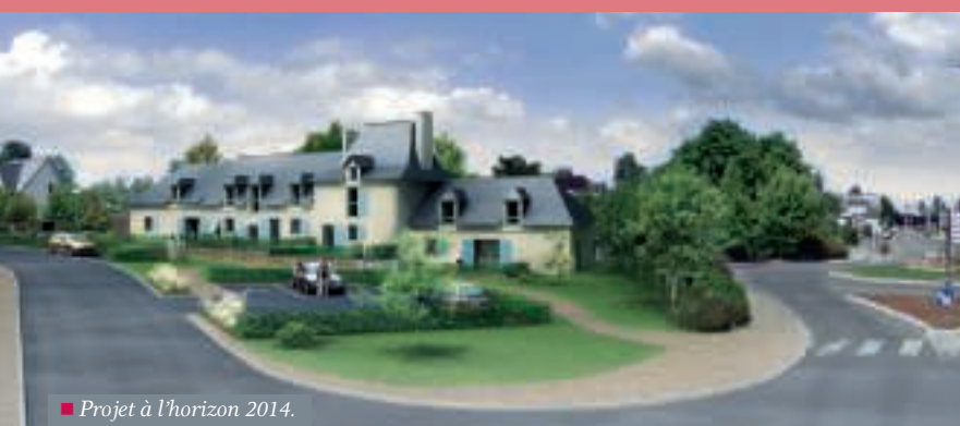
Projet à l'horizon 2014.

Le marché de maîtrise d'œuvre a été confié, par la société Habitat 35, à Vincent Boulet Architecte DPLG. Courant juin, le projet a été présenté en commission municipale ainsi qu'aux riverains proches de la Ferme de la Marionnais. Il consiste en la restructuration des bâtiments principaux de la ferme, à l'exception de la grange à colombage trop abimée. Les murs seront conservés à l'identique et réenduits terre et chaux. La charpente bois sera renforcée et parfois déposée