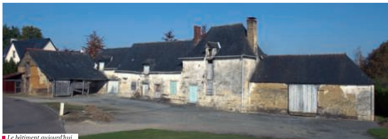
Le bâtiment aujourd'hui.

A la demande de la ville de Chartres, Rennes Métropole l'acquiert. Dans le cadre du renouvellement urbain, la ferme sera réhabilitée. Sept logements en location aidée, gérés par Habitat 35, trouveront leur place dans l'ancienne ferme. Bientôt, la cour de la Marionnais verra à nouveau grandir des générations de petits Chartrains.