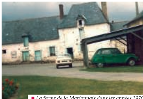
La ferme de la Marionnais dans les années 1970.