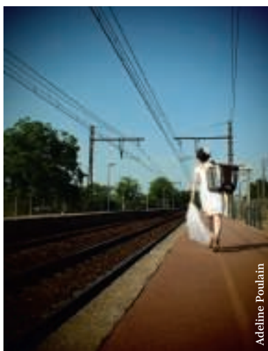
■ Chloé Lacan

Après la trêve estivale, toutes les entités présentes au Pôle Sud vous déroulent le tapis rouge pour Le Grand Dimanche , le 30 septembre.