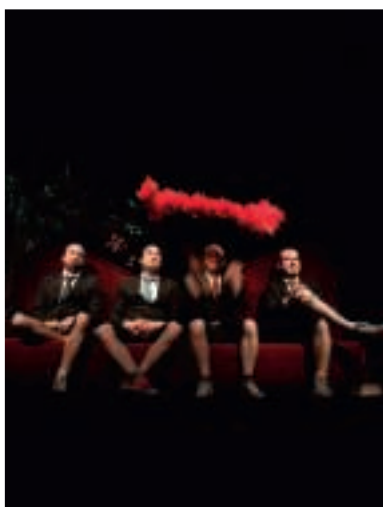
■ Ministère Magouille

Depuis son ouverture en 1987, le centre culturel n'a cessé de soutenir la création artistique dans toute sa diversité. Ainsi, à l'issue d'une résidence de deux semaines, les satiriques compères de Ministère Magouille présenteront « Promenons-nous dans les boas » ou l'insolite histoire des cabarets (22 et 23 novembre).