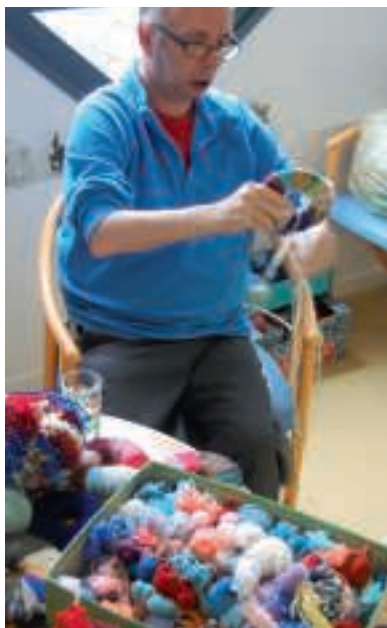
■ Du côté du Foyer de Vie, la spécialité est la confection des pompons.

Il est 16h dans l'atelier de l'Ehpad de la Poterie. Des résidentes, des bénévoles, des membres du personnel soignant, l'animatrice... une dizaine de dames, d'âges et d'horizons différents partagent, le temps d'un après-midi une activité très appréciée et fédératrice : le tricot.