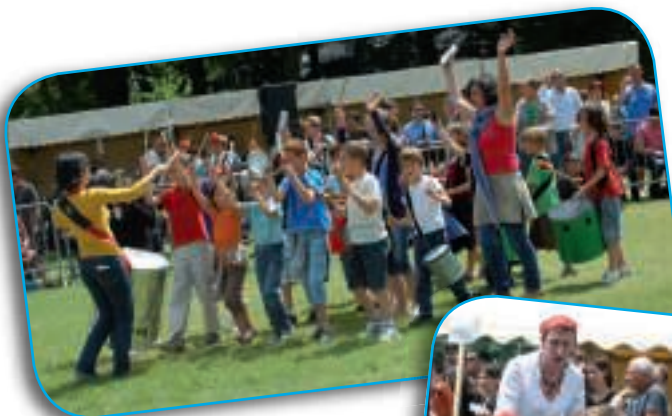
■ Brocéliande et Auditoire, le 23 juin.