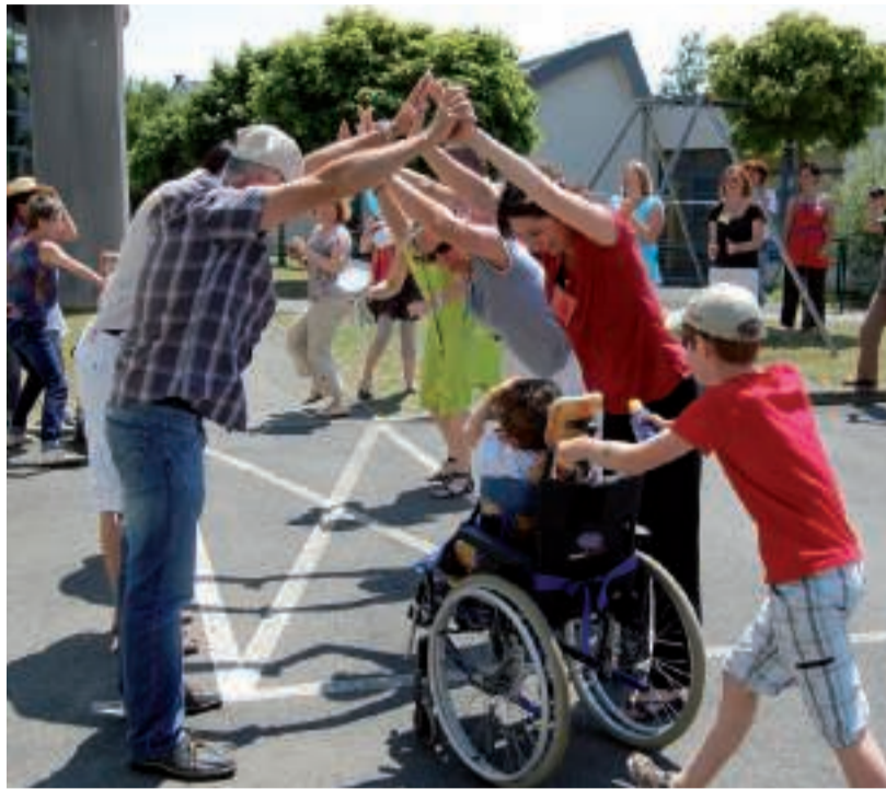
■ Kermesse d'été en 2011.