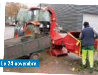
... Le 24 novembre.

En Mairie, cérémonie en l'honneur des médaillés du travail de l'année 2012.