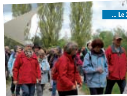
La balade de mobilisation contre le cancer a rassemblé plus de 80 marcheurs.