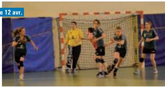
Demie-finale de coupe de Bretagne féminine de Handball... Match serré pour l'Espérance de Chartres... Un beau parcours malgré la défaite.