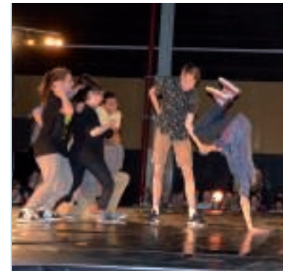
Le 28 juin, à la Halle de La Conterie, spectacle de fin d'année pour tous les élèves de danse contemporaine et de Hip-hop.