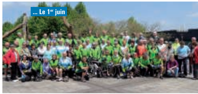
... Le 1 er juin