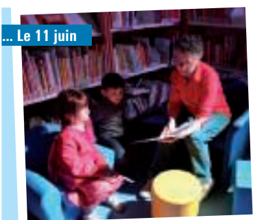
... Le 11 juin