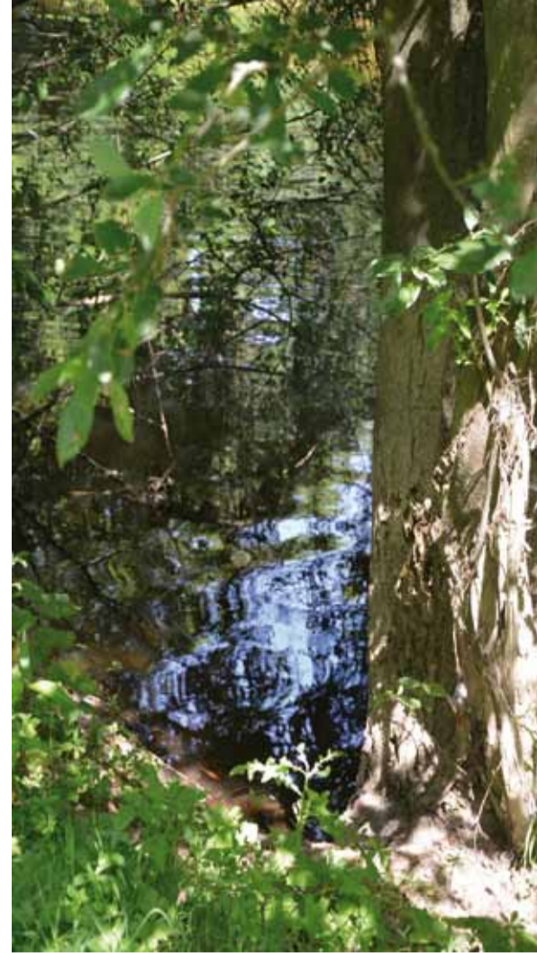
Le ruisseau de la Mécanique va ainsi retrouver ses méandres et confortera un véritable "corridor vert" dans le nouvel éco-quartier.

Le projet intègre également la création de zones d'expansion de crue et de décanation des eaux pluviales. Les travaux, évalués à 922 000 € HT, seront réalisés en 3 ou 4 tranches sur les années 2013 à 2016.