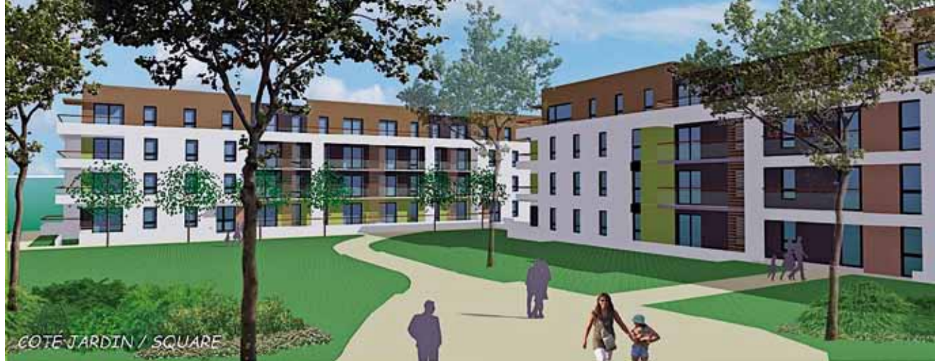
COTÉ JARDIN / SQUARE

E n 1975, Habitat 35 construit deux bâtiments de 12 logements locatifs sociaux chacun, dans le square du Béarn. Ces bâtiments présentent aujourd'hui des signes d'obsolescence majeure. Une réhabilitation, même lourde, n'aurait pas permis de respecter les exigences qualitatives et de performances demandées pour les constructions actuelles : "Tout au long de la phase de réflexion, une large concertation a été engagée et entretenue entre la Mairie, les riverains, les locataires occupants et le bailleur