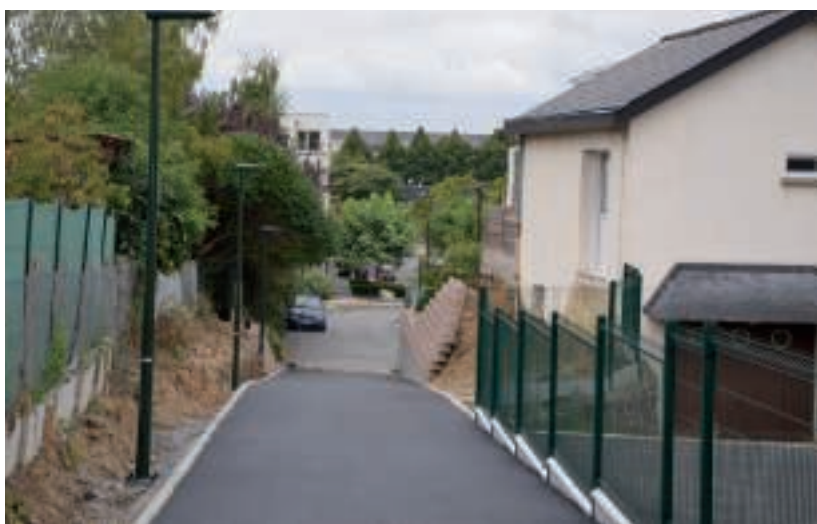
■ Ce chemin nouvellement aménagé et équipé de lanternes nouvelle génération permet désormais de rejoindre la rue de Fénidan et le secteur de l'école de l'Auditoire en venant du centre commercial.

Pour l'avenue du Maine, le choix s'est porté sur la "lampe à décharge" qui a une couleur plus blanche que les anciennes lampes au sodium, avec un meilleur rendement pour une consommation moindre. Le programme de rénovation 2013 porte sur l'allée et l'impasse du Four Chesnel, la rue du Roussillon, le rond-point de la Chaussairie, l'accès du centre d'animation l'Igloo, la rue de Fontenay et la liaison douce entre la rue de Craïova et la rue de Fénidan.