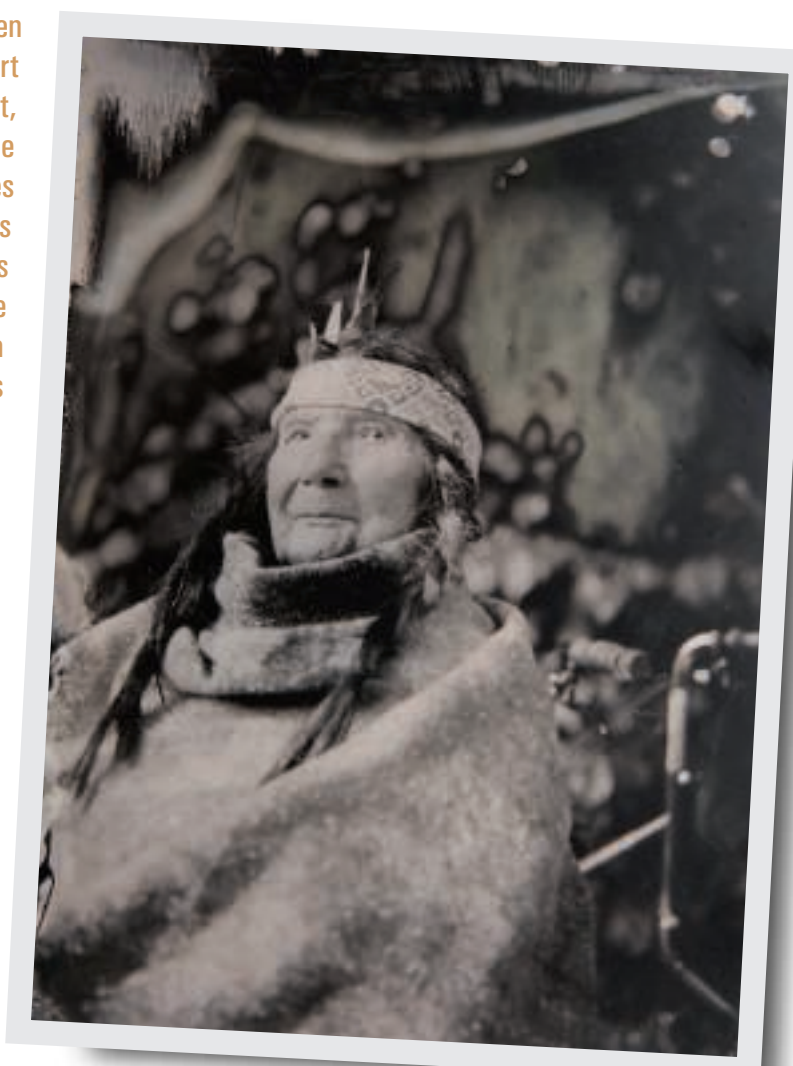
Une Chartraine s'est prêtée au jeu photographique de Muriel Bordier... La reconnaissez-vous ?

L'objectif de cette résidence de création était de favoriser l'émergence de représentations à la fois documentaires et artistiques. Le parti pris artistique a été de retenir une technique datant du XIX e siècle : le collodion humide et la prise de vue à l'aide de chambres photographiques de grand format. Ce procédé permet d'obtenir des clichés sur plaques de verre ou de métal d'une grande finesse et de rendre une gamme de gris particulièrement étendue. Outre la nature aléatoire du résultat, la contrainte majeure de ce procédé concerne le temps de réalisation de l'image : en effet, les plaques doivent être exposées puis développées juste après leur préparation, alors qu'elles sont encore humides (20 minutes maximum). Issu d'univers artistiques différents, chaque photographe a ainsi