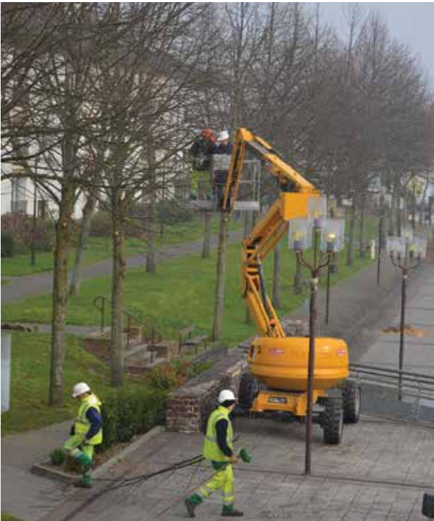
■ Afin de préserver et valoriser nos arbres, la première des trois campagnes d'élitage aura lieu en janvier.