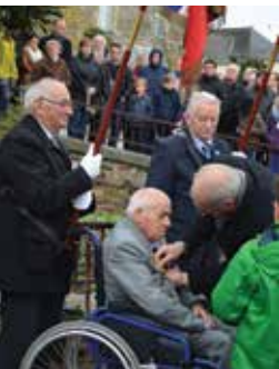
■ 50 roses ont été déposées dans le Jardin du souvenir.