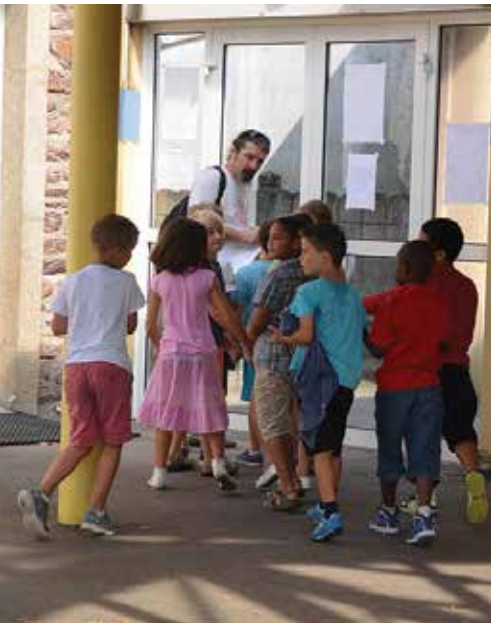
■ Nouveaux tarifs des services Enfance-Jeunesse au 1 er /01/15.

tion du maître-d'œuvre pour la réalisation de la chaufferie bois et du réseau de chaleur (tranche conditionnelle n°4 du marché). Cet avenant, d'un montant global de 36 168,65 € HT a pour effet de porter le montant global du marché de prestations intellectuelles, de 1 119 704,17 € HT à 1 155 872,82 € HT.