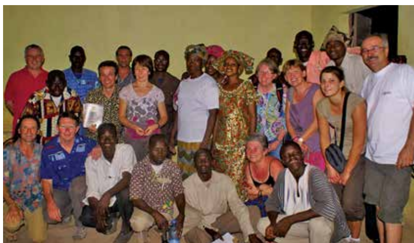
■ En 2010, l'association Teria chartreuse en visite à Tendéli.