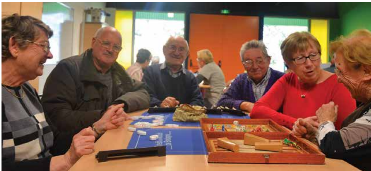
■ Les adhérents du Club de l'Amitié se réunissent à la Maison des Associations 2 fois par semaine autour d'activités de loisirs.

En proposant des séjours et des activités ludiques, conviviales et diversifiées, le Club de l'Amitié de Chartres de Bretagne fait toujours autant d'adeptes après 40 ans d'existence ! Fondée en 1974, l'association n'a pas pris une ride et continue d'animer les loisirs de ses 170 adhérents.