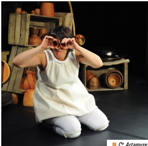
■ C ie Artamuse.