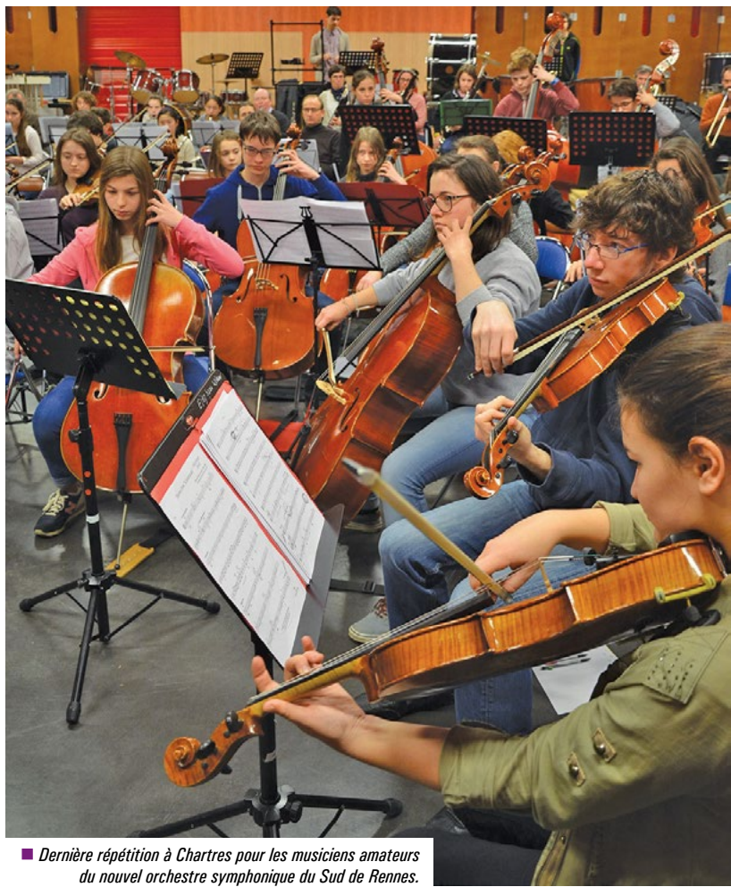
■ Dernière répétition à Chartres pour les musiciens amateurs du nouvel orchestre symphonique du Sud de Rennes.