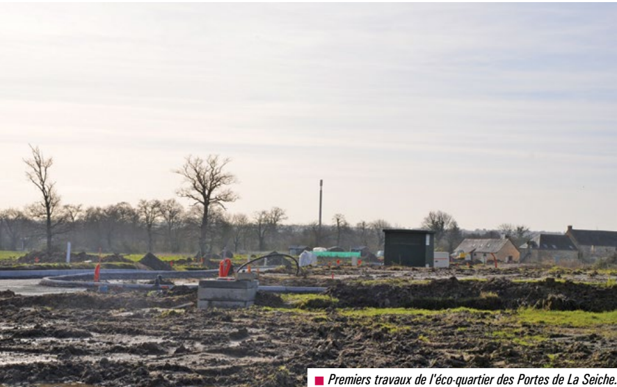
■ Premiers travaux de l'éco-quartier des Portes de La Seiche.