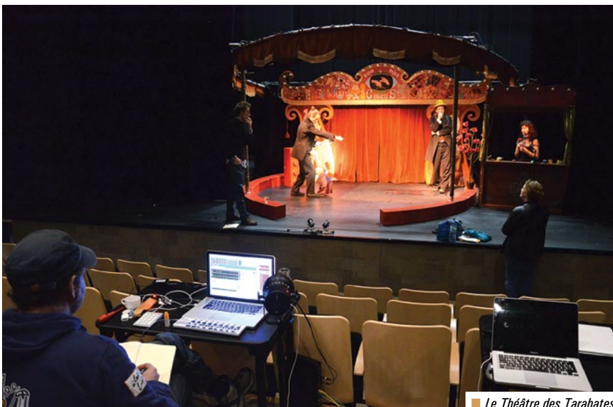
■ Le Théâtre des Tarabates.

"Il est important d'accompagner les artistes dès la genèse de leurs projets pour que ceux-ci puissent émerger. Au-delà de la recette liée au spectacle