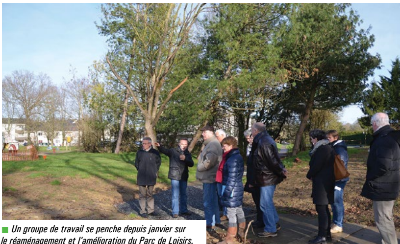
■ Un groupe de travail se penche depuis janvier sur le réaménagement et l'amélioration du Parc de Loisirs.