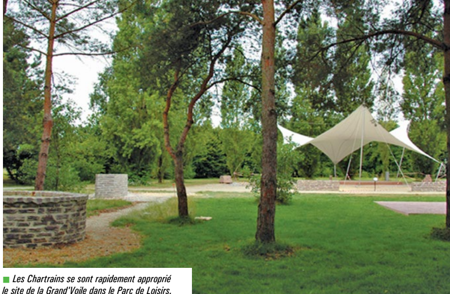
■ Les Chartrains se sont rapidement approprié le site de la Grand'Voile dans le Parc de Loisirs.