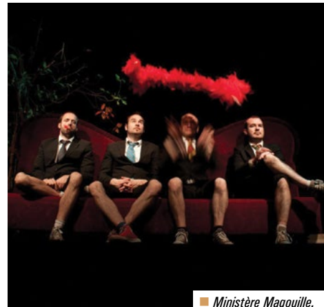
■ Ministère Magouille.