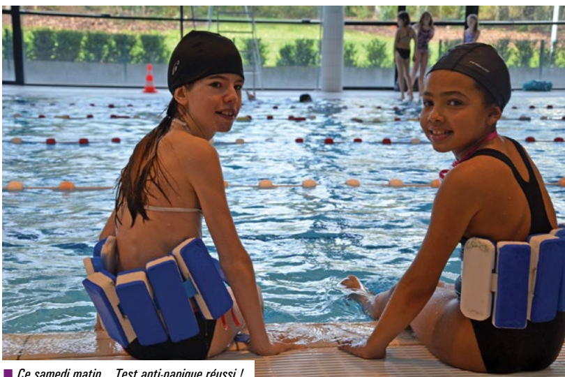
■ Ce samedi matin... Test anti-panique réussi !

Le test consiste à vérifier l'aptitude du mineur à effectuer un saut dans l'eau, à flotter sur le dos, à rester en position verticale pendant 5 secondes, à se déplacer sur le ventre pendant 20 mètres et à passer sous une ligne d'eau ou un objet flottant. Ce test peut être réalisé avec une ceinture de sécurité et n'exige donc pas que l'enfant sache nager. Le test "boléro", souvent demandé dans les activités gérées par l'Education Nationale, comprend les mêmes épreuves mais l'enfant est habillé.