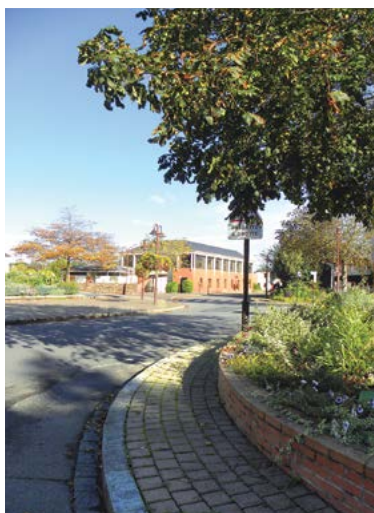
■ Des travaux de voirie sont prévus dans le centre ville.

■ Rond-point du centre : en raison d'un affaissement de la chaussée autour du rond-point, des travaux de voirie seront réalisés par une entreprise extérieure.