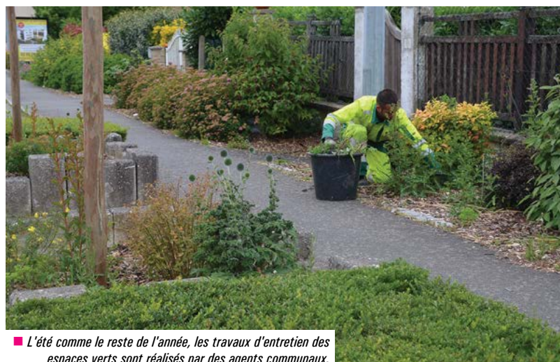
■ L'été comme le reste de l'année, les travaux d'entretien des espaces verts sont réalisés par des agents communaux.

■ Avenue de la Seiche : Création d'un passage piéton entre le lieu-dit de La belle Epine et les nouveaux logements.