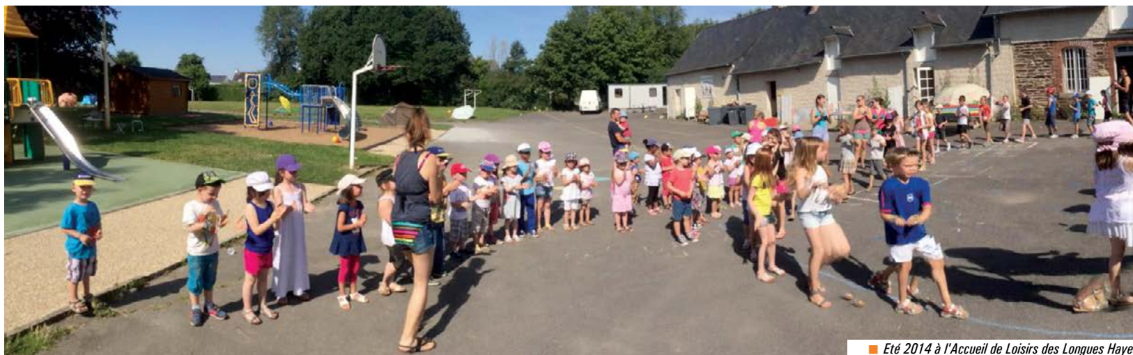
■ Été 2014 à l'Accueil de Loisirs des Longues Hayes.

Séjours, accueil de loisirs, créasports ou soirs d'été, cette année encore toute l'équipe d'animation de la Ville a concocté un programme riche et varié pour les Chartrains entre 2 et 17 ans.