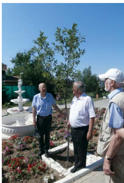
■ Les maires des deux communes devant le chêne planté ensemble il y a 3 ans.

. Du 31 mai au 8 juin, un groupe de 30 Chartrains dont les membres du comité de jumelage "Chartres/Roumanie" s'est rendu à Calarasi, ville jumelée avec Chartres depuis 2000. Outre les visites touristiques, les festivités et réceptions officielles se sont succédé dans la bonne humeur grâce à un accueil chaleureux de nos amis roumains.