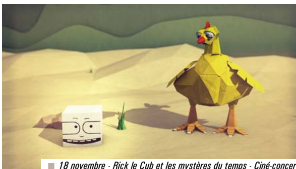
■ 18 novembre - Rick le Cub et les mystères du temps - Ciné-concert

Plaquette de la saison disponible fin août en mairie, au Pôle Sud et sur www.ville-chartresdebretagne.fr + d'infos au 02 99 77 13 20.