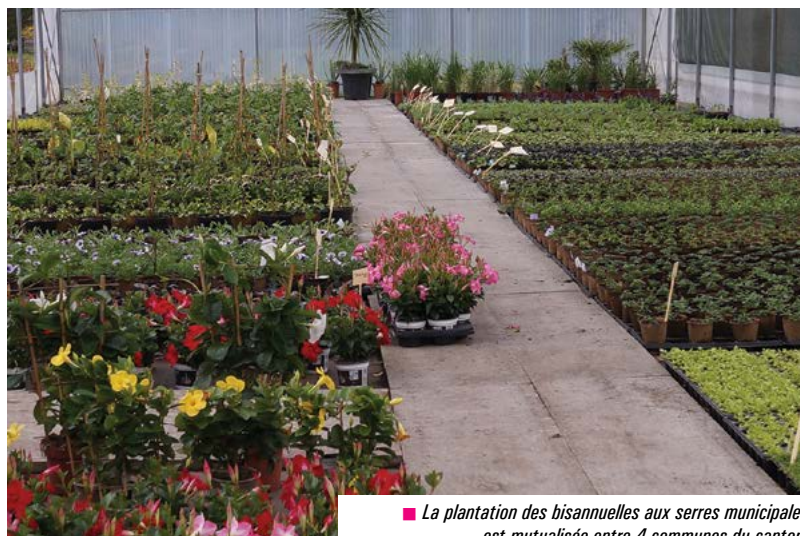
■ La plantation des bisannuelles aux serres municipales est mutualisée entre 4 communes du canton.

Attribution du marché de maîtrise d'œuvre (information) : le marché d'aménagement de locaux pour la crèche et de locaux tertiaires à l'Espace Brocéliande, a été attribué au groupement constitué par le cabinet d'architectes MAGMA et le bureau d'études fluides A2I.