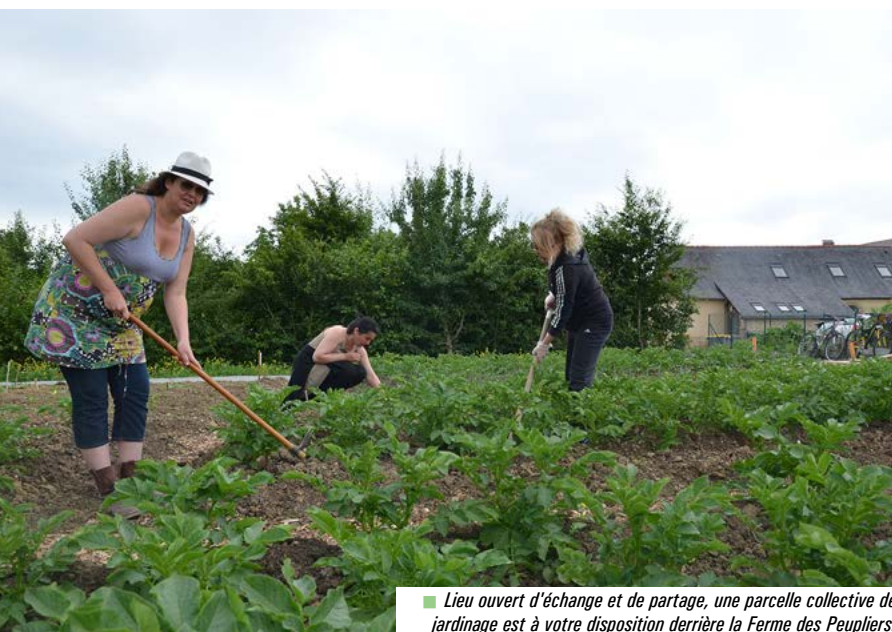
■ Lieu ouvert d'échange et de partage, une parcelle collective de jardinage est à votre disposition derrière la Ferme des Peupliers.

Depuis mai, derrière la Ferme des Peupliers, le centre communal d'action sociale et la ville ont aménagé un jardin ouvert et collectif à destination des Chartrains. Entre arrosage, binage et désherbage, les liens se tissent.