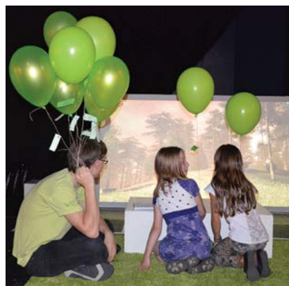
■ La 4 e Rêv'Party le 9 juin à la Médiathèque... lecture, spectacle, origami, découverte 3D, expo... Tout un programme prévu pour faire passer une excellente fin d'après-midi aux petits, tout-petits et plus grands.