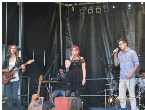
■ Samedi 6 juin, un peu avant l'heure, le concert du Son dans les buissons a rassemblé les Chartrains autour de la musique.