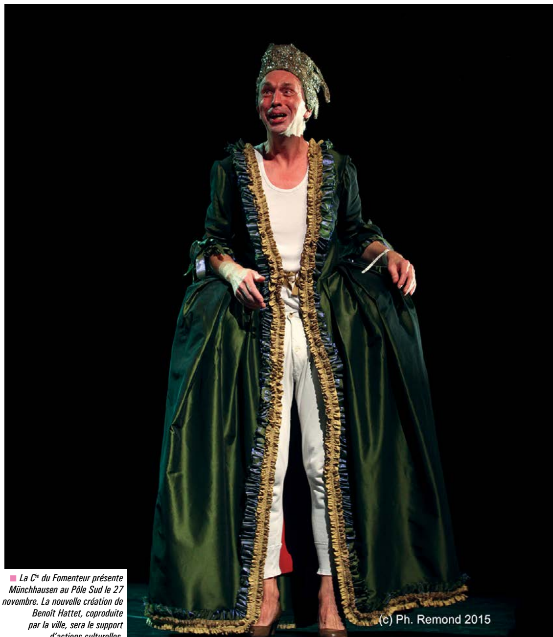
■ La C ie du Fomenteur présente Münchhausen au Pôle Sud le 27 novembre. La nouvelle création de Benoît Hattet, coproduite par la ville, sera le support d'actions culturelles.