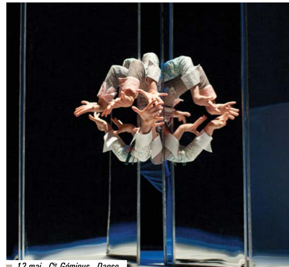
■ 12 mai - C° Géminus - Danse