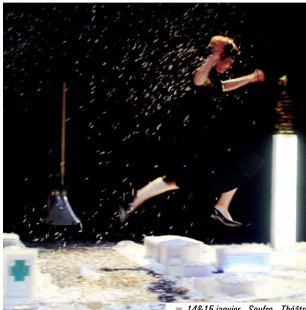
■ 14&15 janvier - Soufre - Théâtre