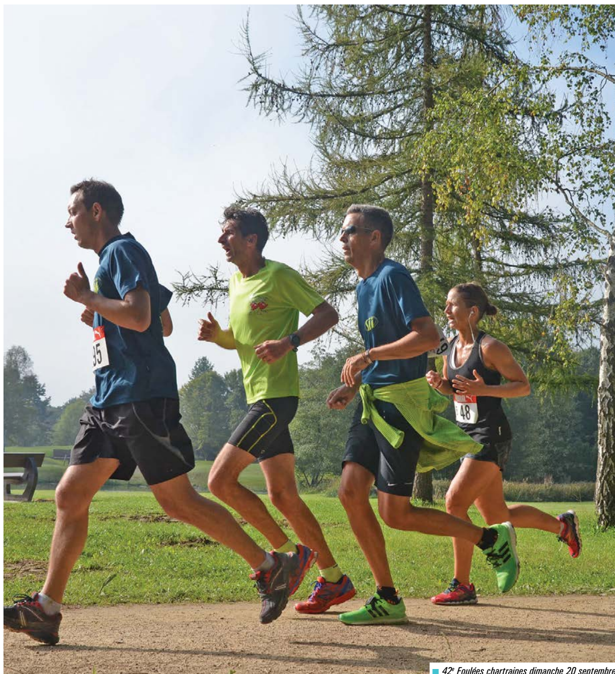
■ 42 e Foulées chartraines dimanche 20 septembre.