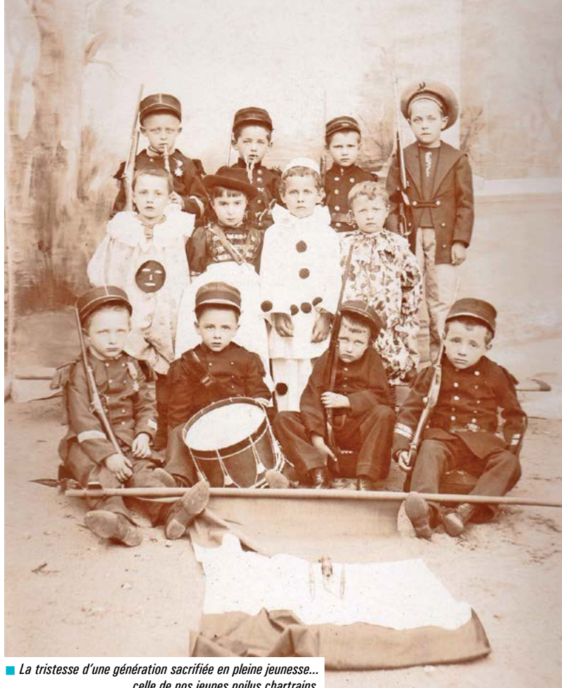
■ La tristesse d'une génération sacrifiée en pleine jeunesse... celle de nos jeunes poilus chartrains.

la Compagnie de théâtre Ligne de nuit rejoints par de nouveaux acteurs de tout le département, l'ensemble vocal Le Diapason avec la participation de la Compagnie Boréale's pour les lectures de lettres de poilus. Le spectacle présenté salle Jacques Brel sera suivi d'un échange convivial dans l'espace Cabaret du Pôle Sud.