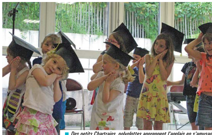
■ Des petits Chartrains, polyglottes apprennent l'anglais en s'amusant.

Les premiers Chartrains devenus "Petits Polyglottes" ont aujourd'hui une trentaine d'années ! Créée il y a 25 ans, grâce à la volonté d'une poignée de parents, cette association, membre de la Fédération Espérance, a pour vocation d'initier à l'anglais, de façon ludique, les enfants de la maternelle au CE1. Grâce à l'implication constante de parents bénévoles dans le bureau, les Petits Polyglottes rassemblent plus d'une cinquantaine