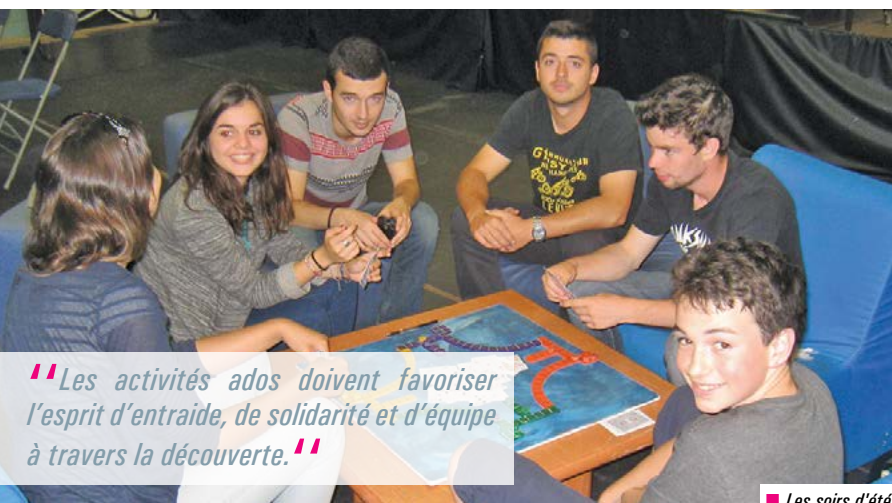
■ Les soirs d'été.

Pour accompagner chaque enfant dans la construction de sa personnalité, la municipalité de Chartres de Bretagne conduit des actions très diversifiées. Depuis bien des années, elle soutient l'apprentissage de la vie collective et favorise l'égalité des chances dans le respect des valeurs de la laïcité. Cet accompagnement concerne les publics de 2 à 25 ans.