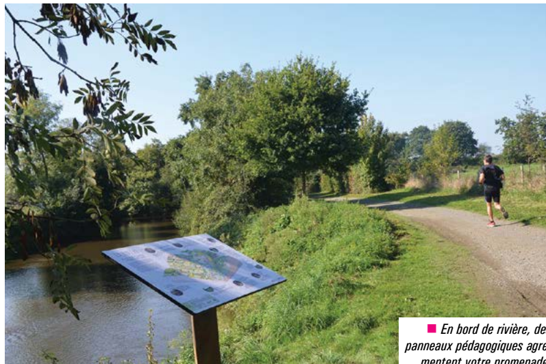
■ En bord de rivière, des panneaux pédagogiques agrémentent votre promenade.

Parce que protéger l'eau est l'affaire de tous, le Syndicat Intercommunal du Bassin Versant de la Seiche en partenariat avec la commune de Chartres de Bretagne a installé des panneaux d'information et de sensibilisation sur les chemins des bords de Seiche.