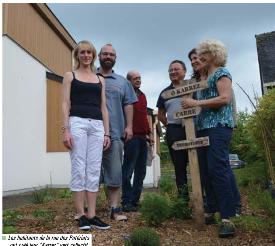
Les habitants de la rue des Potériats ont créé leur "Karrez" vert collectif.

L'activité de jardinage n'est pas une finalité en soi. C'est presque un prétexte pour rompre l'anonymat, favoriser les rencontres et nouer des liens entre les habitants du quartier quels que soient leur âge, leur culture et leur milieu social : "Les voisins qui le souhaitent sont invités à se retrouver tous les 15 jours pour entretenir notre jardin