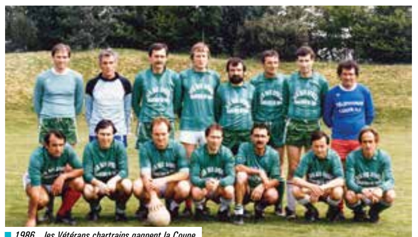
■ 1986... les Vétérans chartrains gagnent la Coupe.

Pour la petite histoire... Le 7 juin 1986, l'une des deux équipes vétérans de football de l'Espérance remporte la finale départementale de la coupe vétérans. Mardi 7 juin 2016, 30 ans plus tard, jour pour jour, à l'initiative de Michel, les joueurs se sont retrouvés pour partager une journée tous ensemble et revoir leurs exploits, la finale ayant été filmée.