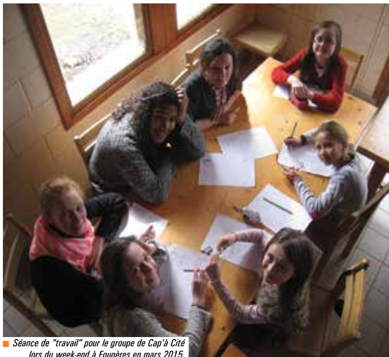
■ Séance de "travail" pour le groupe de Cap à Cité lors du week-end à Fougères en mars 2015.

C e dispositif communal à destination des jeunes, mis en place en 2013 a été conçu pour encourager les initiatives, favoriser le vivre ensemble, l'autonomie et la prise de responsabilité. Les Chartrains souhaitant tenter l'aventure Cap à Cité s'engagent pour 18 mois ponctués de rencontres, d'échanges, de visites, de découvertes sur des thèmes transversaux alternant apprentissage de la citoyenneté et moments ludiques. Le premier semestre favorise le vivre ensemble afin de créer une dynamique