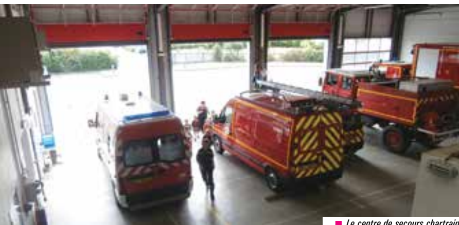
■ Le centre de secours chartrain