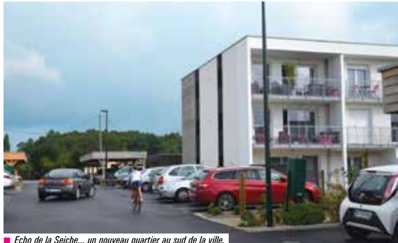
■ Echo de la Seiche... un nouveau quartier au sud de la ville.

Le 15 septembre dernier, les habitants du quartier "Echo de la Seiche" ont été invités à une réunion d'information et d'échange autour de l'évolution de leur environnement. En 2017, une partie de l'avenue de la Seiche verra sa physionomie changer dans le cadre des travaux du nouvel éco-quartier "Les Portes de La Seiche".