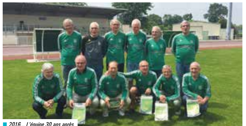
■ 2016... L'équipe 30 ans après.