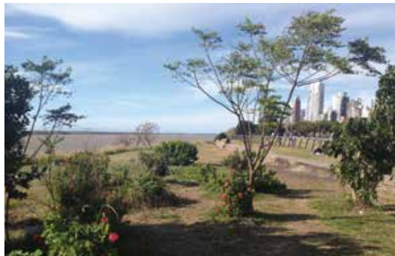
■ Immersion à Rosario en Argentine.

Retour Hélios : vendredi 28 octobre à 20h, salle Victor Basch. Gratuit et ouvert à tous.