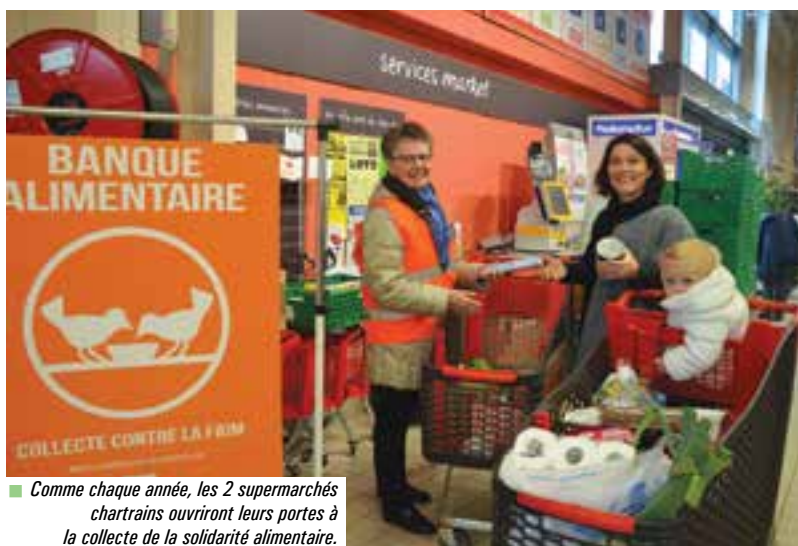
■ Comme chaque année, les 2 supermarchés chartrains ouvriront leurs portes à la collecte de la solidarité alimentaire.

La collecte nationale des banques alimentaires aura lieu vendredi 25 et samedi 26 novembre prochain. C'est un rendez-vous solidaire durant lequel quelques 129 000 bénévoles récupèrent des denrées dans plus de 9 000 points de collectes à travers toute la France.