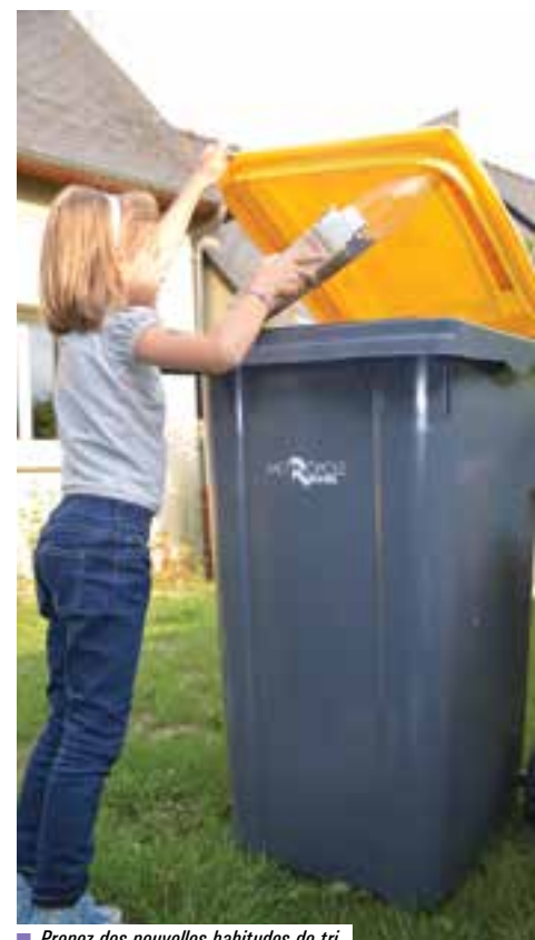
■ Prenez des nouvelles habitudes de tri.

. Les jours de collecte des déchets recyclables restent inchangés.