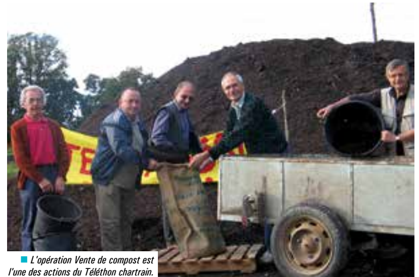
■ L'opération Vente de compost est l'une des actions du Téléthon chartrain.

/// Chaque bénévole qui s'investit est le bienvenu ! ///