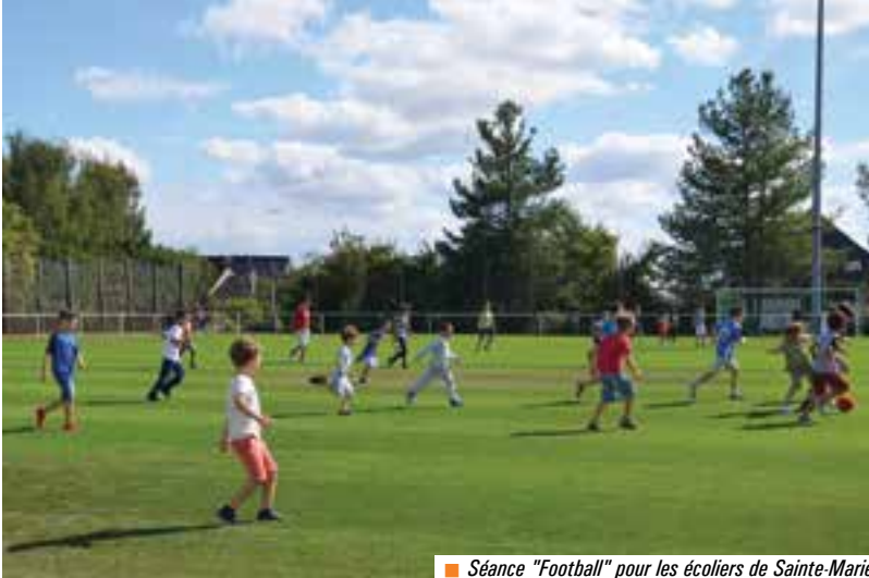
■ Séance "Football" pour les écoliers de Sainte-Marie.

Depuis septembre 2014, la semaine des écoliers chartrains est organisée en 24 h d'enseignement sur 9 demi-journées. Les Temps Educatifs Périscolaires se déroulent deux après-midis par semaine à l'Auditoire et à Sainte-Marie et le midi à l'Ecole Brocéliande. Ils constituent des portes ouvertes sur de nouvelles activités, des moments propices à l'éveil, la curiosité et l'imagination.