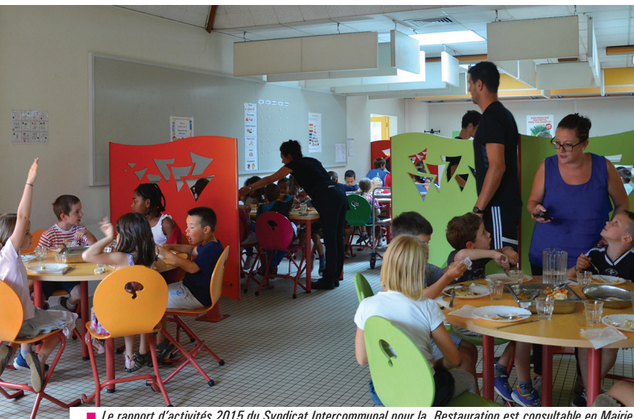
■ Le rapport d'activités 2015 du Syndicat Intercommunal pour la Restauration est consultable en Mairie.

Avant l'ouverture de la séance du Conseil municipal, des représentants d'un collectif mobilisé contre le déploiement du compteur Linky demandent la suspension de l'installation de ces compteurs.