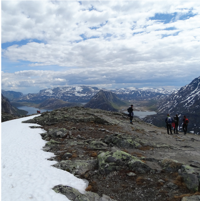
■ La Norvège, sport et grand air.