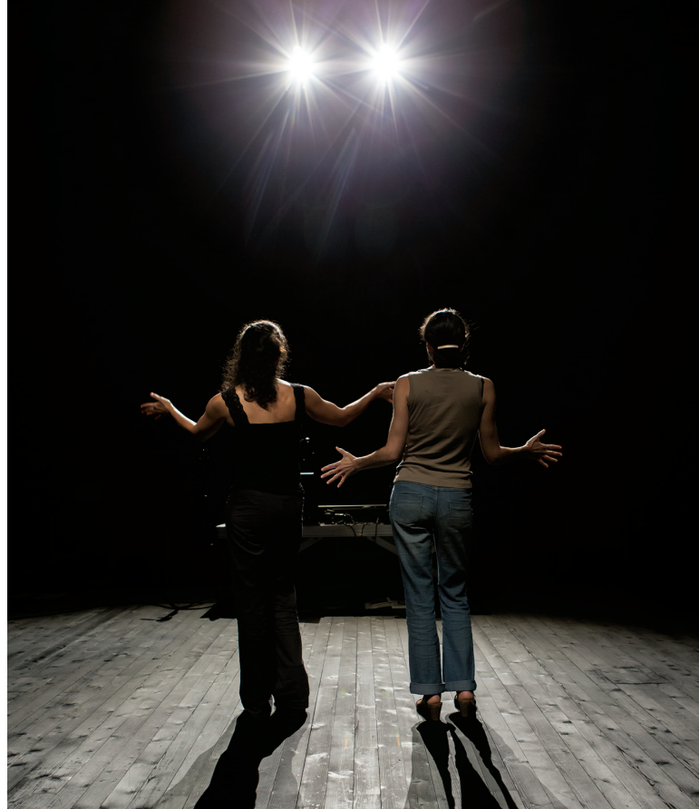
■ La C ie Châteaux de sable sur la scène du Pôle Sud le 27 janvier.

Que nous réserve la soirée du 27 janvier, jour de la Sainte Angèle à Pôle Sud ? Une nouvelle création drôle et poétique de la C ie Châteaux de Sable. Grâce au soutien du centre culturel chartrain, les artistes investissent les lieux dès la mi-janvier pour une résidence de création et un déjeuner sur scène.