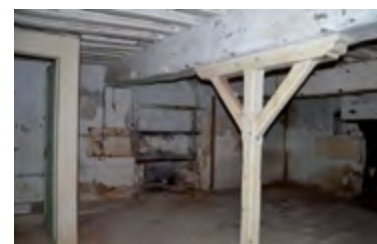
■ Au fond, un vaisselier du 17 e siècle.