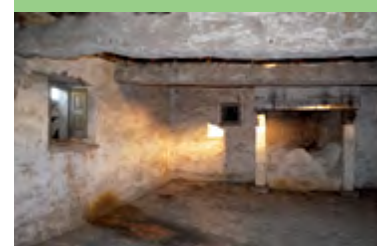
■ A l'étage, les volets sont également d'époque.