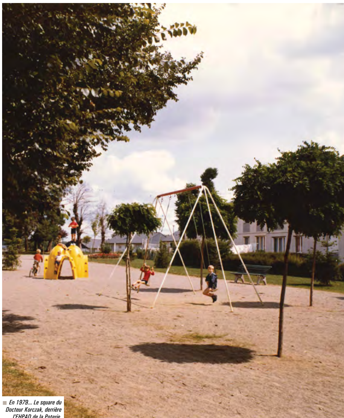
■ En 1979... Le square du Docteur Korczak, derrière l'EHPAD de la Poterie.

(P3) Edito (P4) Expression de la Majorité (P4) Expression de l'Opposition