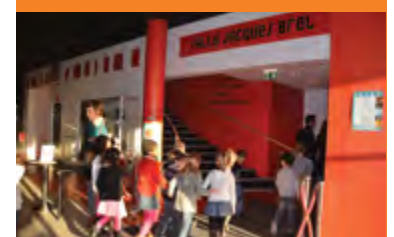
L'école des spectateurs... Direction le Pôle Sud