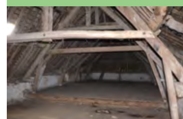
■ Les tomettes et la charpente.