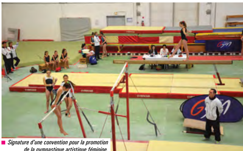
■ Signature d'une convention pour la promotion de la gymnastique artistique féminine.

Par délibération du 4/07/16, le Conseil a confirmé le maintien, à terme, de deux groupes scolaires primaires et validé le programme d'extension de l'école maternelle de Brocéliande. Suite à une consultation, le marché de maîtrise d'œuvre est attribué au groupe-