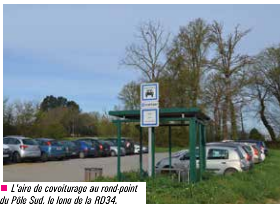
■ L'aire de covoiturage au rond-point du Pôle Sud, le long de la RD34.