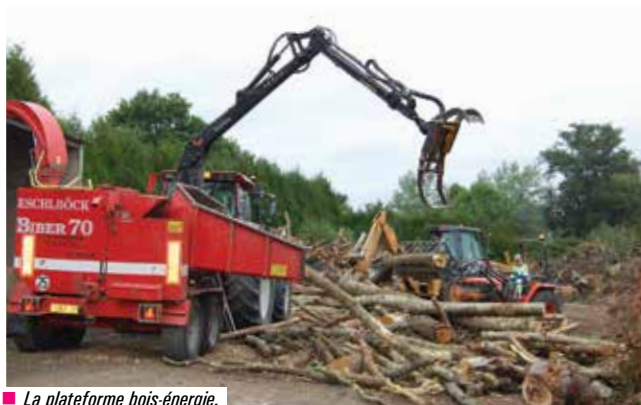
■ La plateforme bois-énergie.

La ville de Chartres de Bretagne s'est engagée depuis longtemps pour relever le défi climatique. Avec des actions concrètes sur le patrimoine communal, les énergies nouvelles et les déplacements doux, la commune a su réduire la consommation d'énergie fossile, diminuer son empreinte carbone et diversifier ses sources d'énergie.