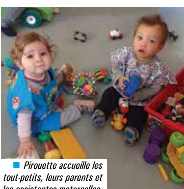
■ Pirouette accueille les tout-petits, leurs parents et les assistantes maternelles.