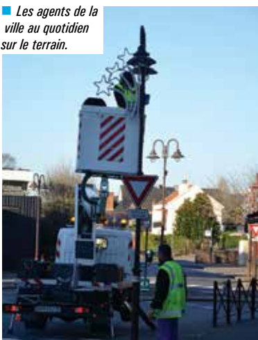
■ Les agents de la ville au quotidien sur le terrain.

regroupent toutes les opérations relatives à l'exploitation et la gestion courante des services. Les intérêts de la dette, les amortissements et le virement à la section investissement ainsi que les dépenses exceptionnelles ne sont pas présentés dans les dépenses listées ci-contre.