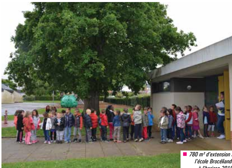
■ 780 m 2 d'extension à l'école Brocéliande à l'horizon 2018.

Le Conseil accepte cet avenant au marché de maîtrise d'œuvre.