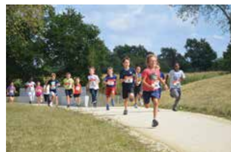
■ Oulipo par les Boréale's.