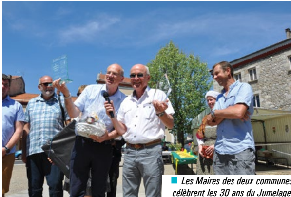
■ Les Maires des deux communes célèbrent les 30 ans du Jumelage.