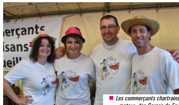
■ Les commerçants chartrains, moteur des Cornes de Feu.

La seconde édition de la fête des Cornes de feu a rassemblé près de 500 Chartrains place de la Mairie le 10 juin dernier.