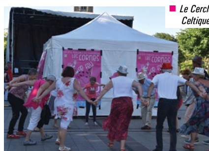
■ Le Cercle Celtique.