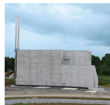
■ La chaufferie-bois produira à terme le chauffage et l'eau chaude sanitaire pour les logements collectifs des tranches 1 et 2, soit environ 500 logements.

Dès septembre, des travaux d'aménagement verront la création d'un arrêt de bus avenue de la Seiche et d'un rond-point provisoire au carrefour avec la rue Jean-Marie Ecorchard.