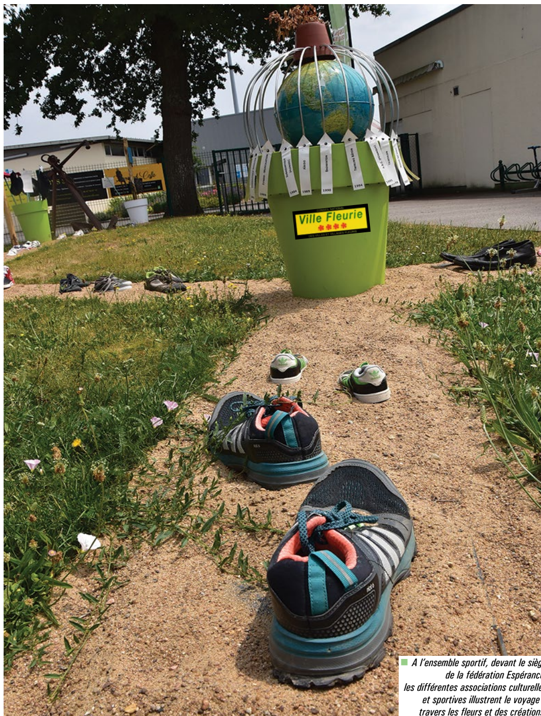
■ A l'ensemble sportif, devant le siège de la fédération Espérance, les différentes associations culturelles et sportives illustrent le voyage à travers les fleurs et des créations.