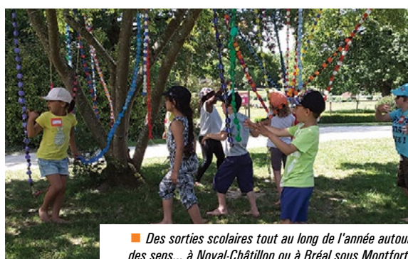
■ Des sorties scolaires tout au long de l'année autour des sens... à Noyal-Châtillon ou à Bréal sous Montfort.

Enfin, le fil rouge annuel a rassemblé tous les enfants aux Jardins de Brocéliande à Bréal sous Montfort les 13 et 15 juin... de quoi réveiller les sens !