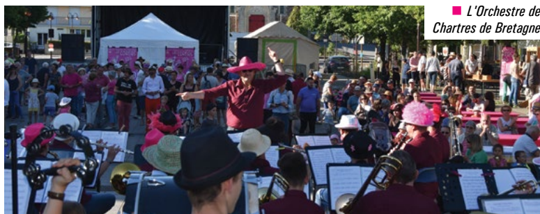
■ L'Orchestre de Chartres de Bretagne

La seconde édition de la fête des Cornes de feu a rassemblé près de 500 Chartrains place de la Mairie le 10 juin dernier.