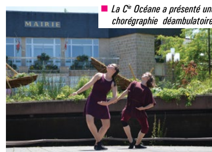
■ La C ie Océane a présenté une chorégraphie déambulatoire.