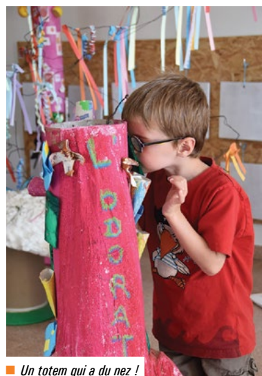
■ Un totem qui a du nez !

J'entends, je goûte, je touche, je sens, je vois... La thématique des "5 sens" a fédéré les six classes de l'école maternelle Brocéliande. De nombreux projets ont été menés toute l'année scolaire.