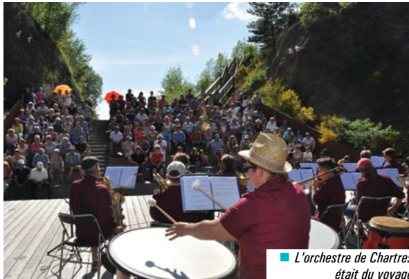
■ L'orchestre de Chartres était du voyage

Les 30 ans du serment de jumelage, signé en 1987, entre Chartres de Bretagne et la commune auvergnate de Saint-Anthème, ont été célébrés à l'occasion d'un déplacement des Chartrains pendant le week-end de l'Ascension.