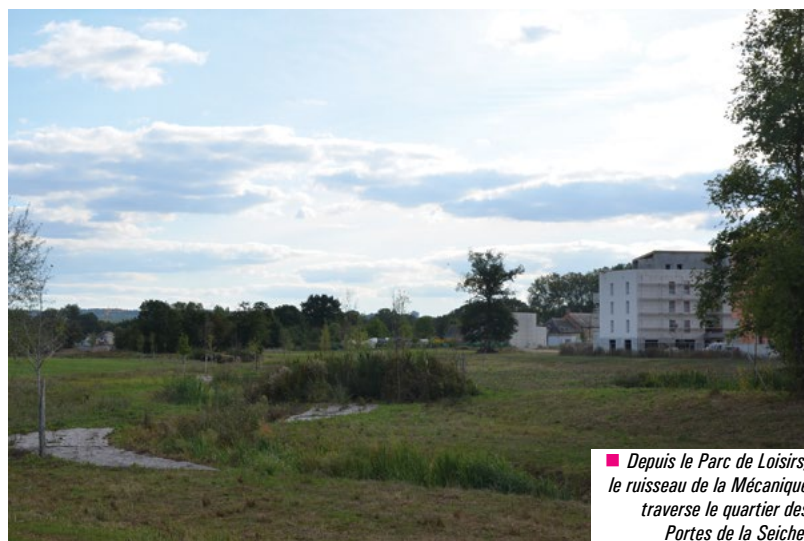
■ Depuis le Parc de Loisirs, le ruisseau de la Mécanique traverse le quartier des Portes de la Seiche.

Ces premières habitations et les futurs logements sont alimentés en chauffage et en eau chaude sanitaire par la chaufferie à bois grâce au réseau de chaleur souterrain. Le nouveau quartier est traversé par le ruisseau de la Mécanique et par une coulée verte et bleue du Parc de loisirs jusqu'à la Seiche.