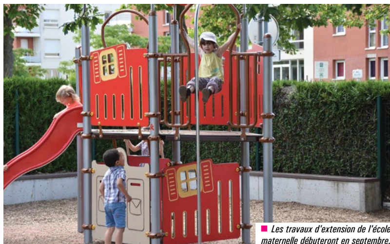
■ Les travaux d'extension de l'école maternelle débuteront en septembre.