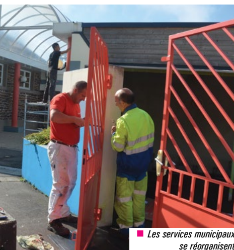
■ Les services municipaux se réorganisent