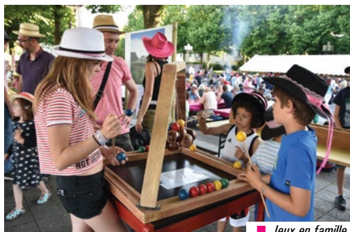
■ Jeux en famille.