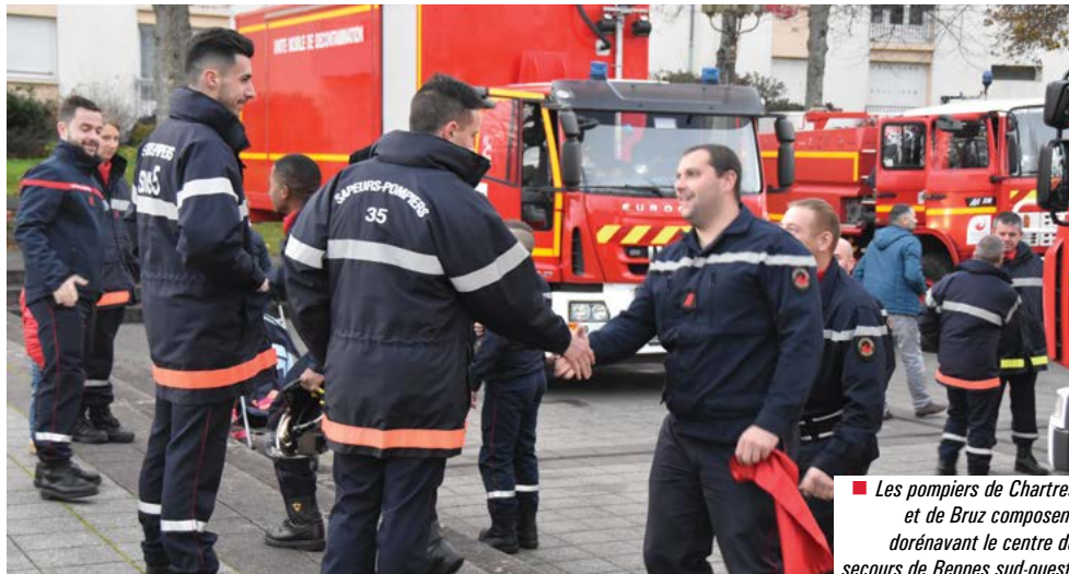
■ Les pompiers de Chartres et de Bruz composent dorénavant le centre de secours de Rennes sud-ouest.