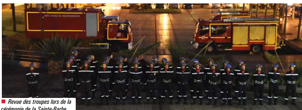
■ Revue des troupes lors de la cérémonie de la Sainte-Barbe.