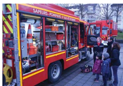
■ Avant la cérémonie, place de la Liberté, les Chartrains ont découvert et visité les véhicules de secours guidés par les sapeurs-pompiers.

Vous pouvez faire acte de candidature auprès du Chef du CIS Rennes Sud-Ouest - 18, rue de la Noé - 35170 Bruz. Tél. 02 99 52 60 63 - Courriel : michel.point@sdis35.fr Plus d'infos sur : www.devenirvolontaire35.fr