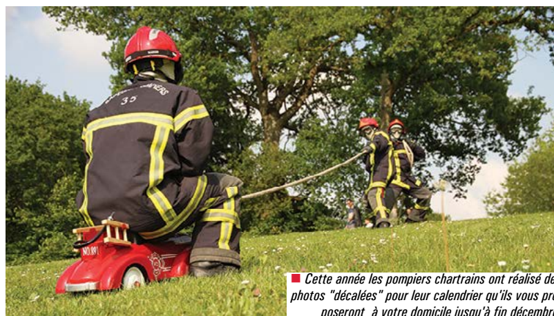
■ Cette année les pompiers chartrains ont réalisé des photos "décalées" pour leur calendrier qu'ils vous proposeront à votre domicile jusqu'à fin décembre.