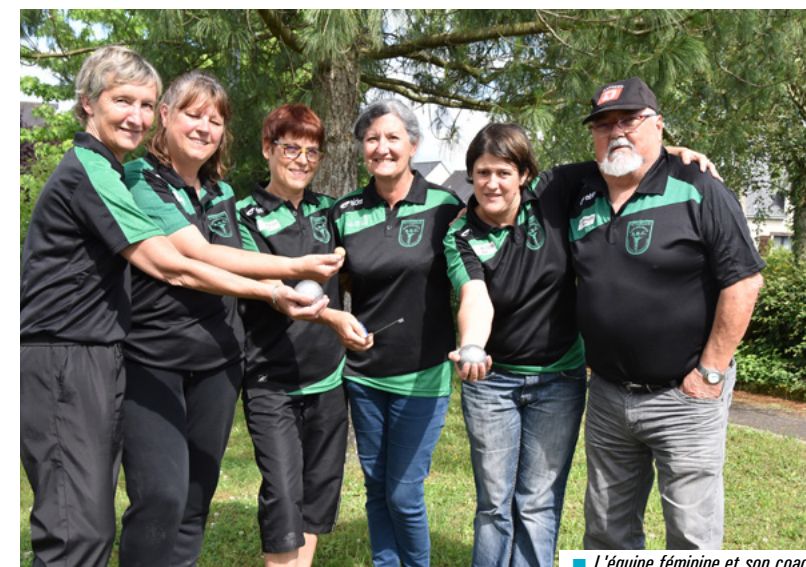
■ L'équipe féminine et son coach.