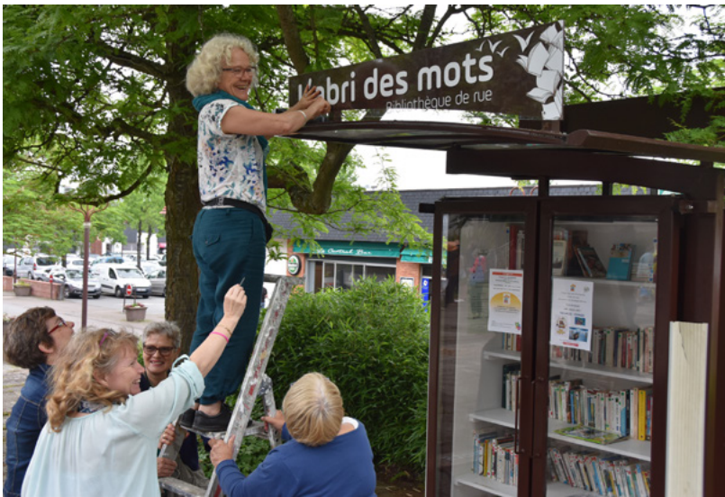
Le 9 juin dernier, à l'occasion de la journée citoyenne, les bénévoles de la bibliothèque de rue ont installé le panneau "l'Abri des mots".

La bibliothèque de rue a vu le jour au printemps 2017 au centre-ville à Chartres de Bretagne, devant l'entrée de la Mairie. Depuis, les Chartrains se sont approprié "l'Abri des mots" et son principe.