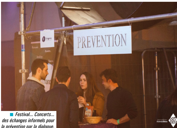
■ Festival... Concerts... des échanges informels pour la prévention par la dialogue.