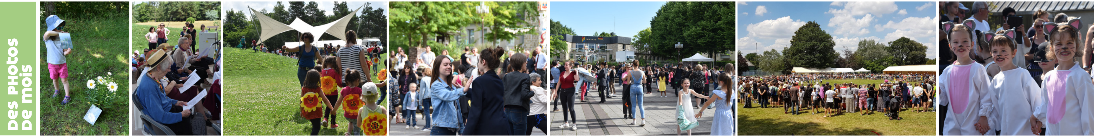
DES PHOTOS DE MOIS