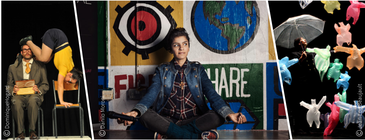
Stoik, le 14 décembre.

Les choix retenus témoignent d'une capacité à nous surprendre, nous étonner, hors des préjugés, toujours dans la recherche d'une cohérence artistique vers tous les publics. Cirque, danse, ciné, musique, le spectacle sera émouvant, étonnant, détonnant, entraînant, bref : vivant !