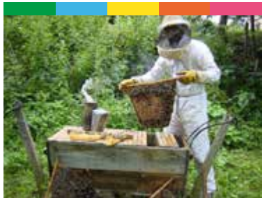
Fabriquer une ruche kényane