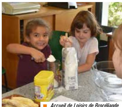
■ Accueil de Loisirs de Brocéliande