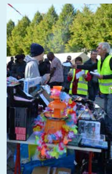
■ 22/09, les bénévoles des comités de jumelages sur le pont pour le vide-grenier.

. Le Parc des Loisirs accueillera des athlètes et de nombreux supporters à l'occasion de la 45 e édition des Foulées Chartraines . Dès 10 heures, les coureurs s'élanceront pour les 10 km au départ de l'avenue Constant Mérel ; l'après-midi la course des écoles chartraines succédera à la course des jeunes dans le Parc.