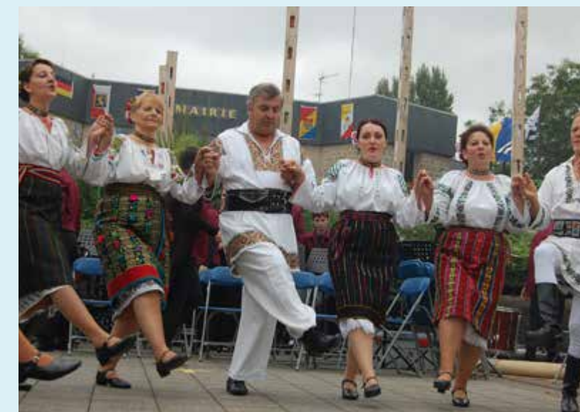
■ 22/09, une délégation roumaine venue de Calarasi nous fera l'honneur de danses, chants et musiques.