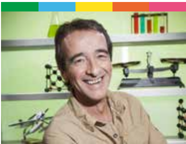
Causerie, conférence avec Fred Courant