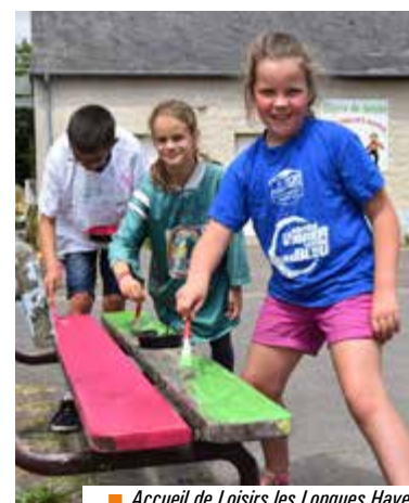
■ Accueil de Loisirs les Longues Hayes

+ de photos sur www.ville-chartresdebretagne.fr