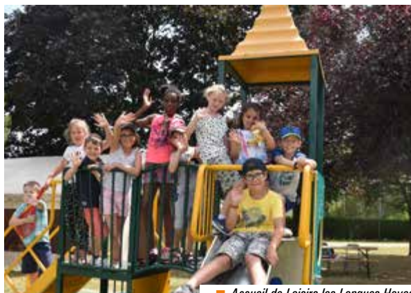
■ Accueil de Loisirs les Longues Hayes