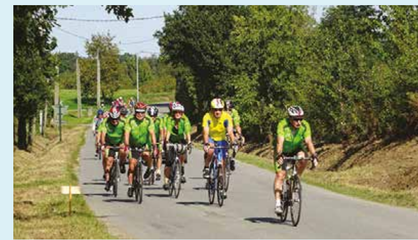
■ 22 et 23 /09...Tous en selle !

. Cette année, l'incontournable Fête des Jumelages et son vide-grenier s'installeront sur l'Esplanade des Droits de l'Homme le samedi 22 septembre. Les 60 bénévoles des comités de jumelages se concentrent sur une journée de fête ( voir programme ci-contre ). En parallèle du vide-grenier, de nombreuses animations autour de la musique et de la danse jalonnent cette journée. A cette occasion, Chartres de Bretagne accueille une délégation roumaine venue de Calarasi, ville jumelée depuis 1992. Un groupe d'artistes roumains nous fera l'honneur de danses, chants et musiques de leur pays.