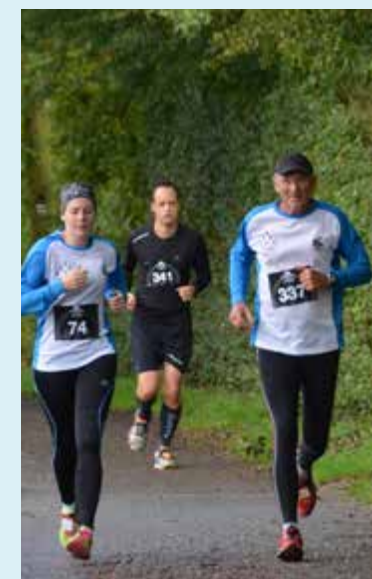
■ 16/09 Les Foulées Chartraines