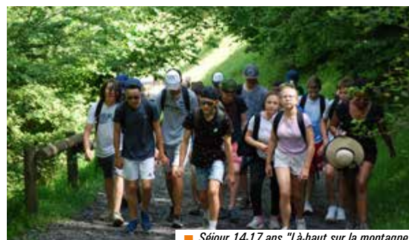
■ Séjour 14-17 ans "Là-haut sur la montagne"