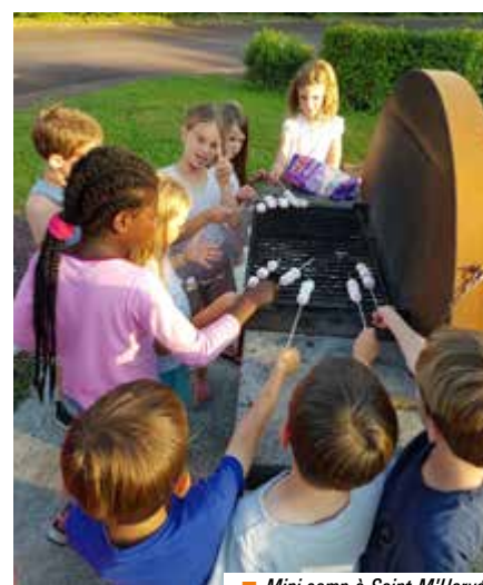
■ Mini-camp à Saint M'Hervé