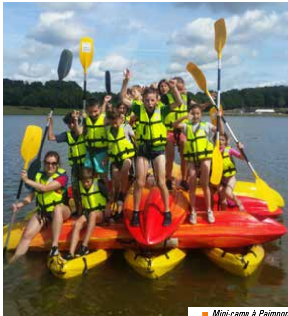
■ Mini-camp à Paimpont