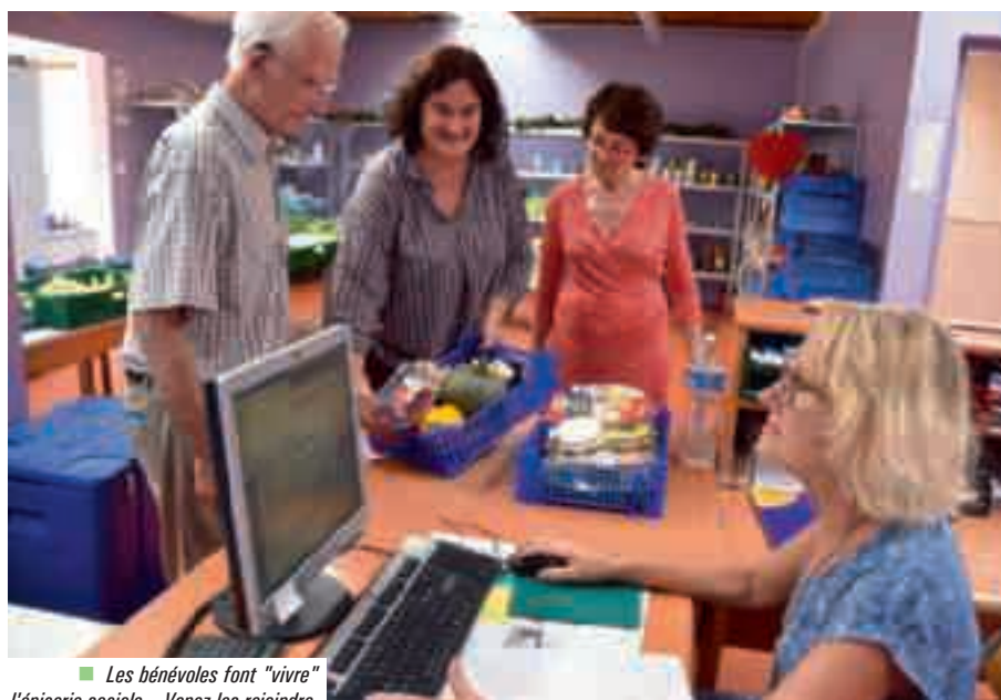
■ Les bénévoles font "vivre" l'épicerie sociale... Venez les rejoindre.