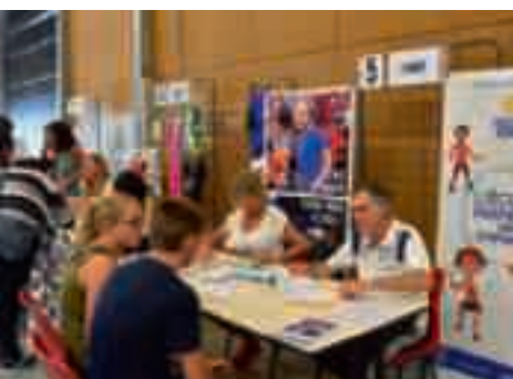
■ Le Forum, l'incontournable rendez-vous de la rentrée.