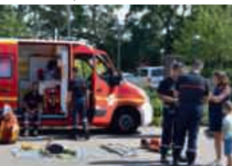
■ Les sapeurs-pompiers volontaires ont réalisé des démonstrations de 1 ers secours.