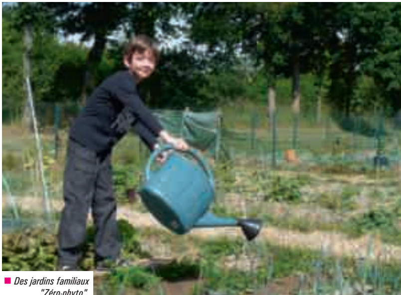
■ Des jardins familiaux "Zéro-phyto".