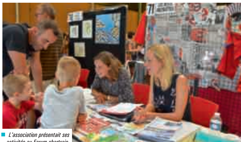
L'association présentait ses activités au Forum chartrain.

Apprendre les langues en s'amusant, c'est le crédo de l'Association Espérance Les Petits Polyglottes créée en 1990. Les séances sont proposées dès la petite section et jusqu'au CM2 (selon les langues), dans les locaux des écoles publiques Brocéliande et Auditoire.