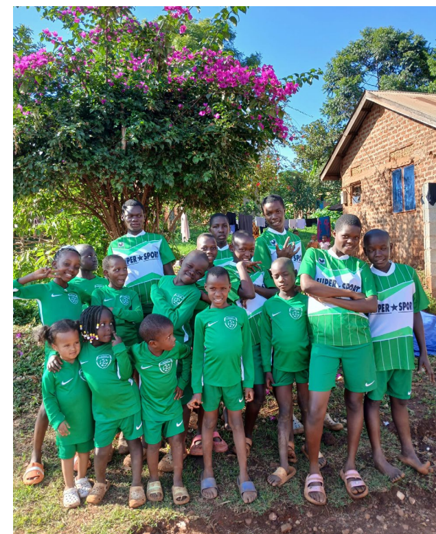
■ A Kaggwa, les enfants du centre jouent aux couleurs de Chartres-de-Bretagne grâce à un don de l'Espérance football.