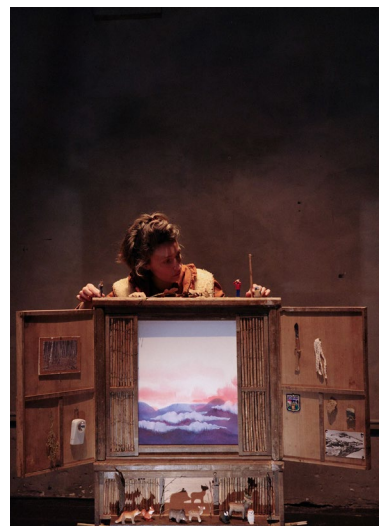
■ La peau du Lynx, C* La Levée, le 6 déc.