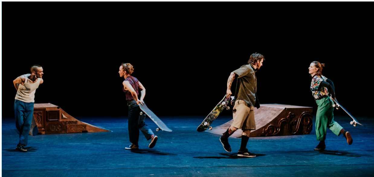
■ Compagnie C'hoari. Danse et skate. Dim. 28 septembre à 16h. De 6 à 107 ans. Gratuit, réservation conseillée.

La saison culturelle s'ouvrira dès le dimanche 28 septembre, avec une journée mêlant tous les secteurs du Pôle Sud. Suivez le guide !