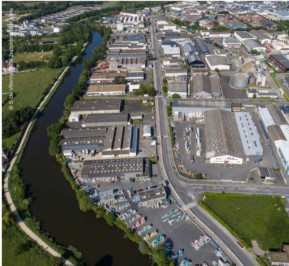
© S. de Villeroi, RW Zeppelin, Bretagne

60 % de la surface à produire issus du renouvellement des zones d'activité existantes