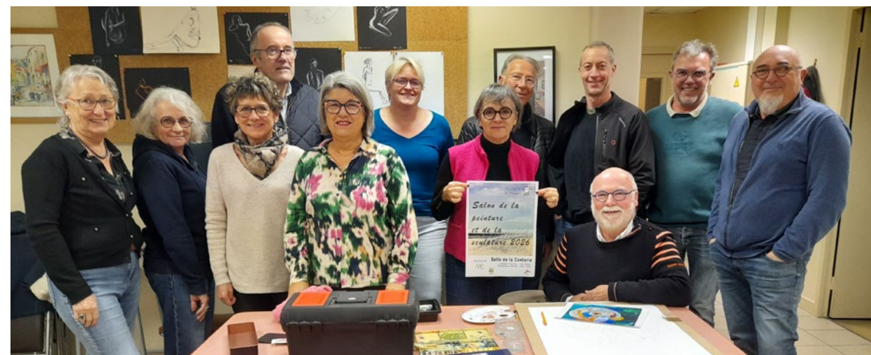
■ Le groupe d'organiseurs du salon des Arts en février prochain.

Avec ses 42 années d'existence, l'activité peinture et dessin n'est pas de nature morte. Elle propose son premier “Salon des arts” en février.