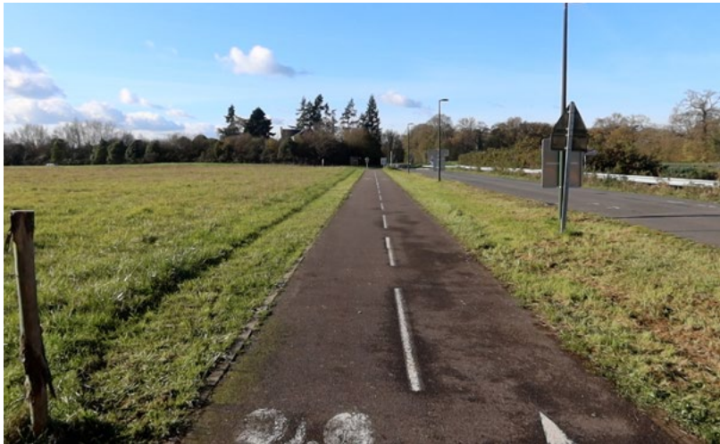
■ La piste cyclable en provenance de Bruz,

C'était le chaînon manquant entre la piste cyclable qui longe la RD44 depuis Bruz et le Réseau Express Vélo (REV) entre Chartres-de-Bretagne et Rennes : une liaison d'un kilomètre est en cours de réalisation du Callouët jusqu'à la Croix aux Potiers. Large de 2,5 m dans sa section parallèle à la RD44, elle se connectera ensuite à la rue André Citroën avant de rejoindre la piste du REV.