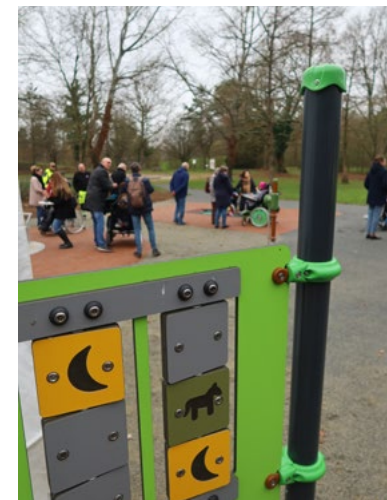
■ Cette aire de jeux a aussi été pensée pour favoriser le jeu entre toutes les générations.

Le droit aux loisirs des enfants handicapés est-il une réalité en ville ? Pour Muriel, mère de la jeune Lylwenn, “les aires de jeux en France font appel à des capacités motrices”. Monter, se hisser, se suspendre... Autant de gestes que certains enfants, suivant la nature de leur handicap, ne peuvent pas accomplir. La nouvelle aire de jeux installée au parc de loisirs réunit des jeux accessibles quel que soit le degré d'autonomie des enfants.