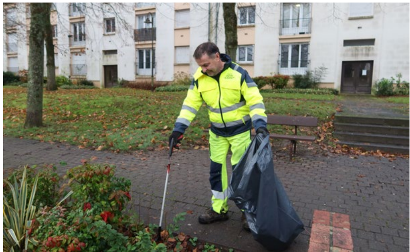
■ Sur le terrain, au quotidien, des agents de la ville assurent la propreté urbaine.

tiques. Pour ce qui concerne les tags, il n'y a pas de saison, mais des pics quand un nouveau tagueur vient imprimer sa signature. "Le temps de nettoyage est long et le produit utilisé pour effacer sans abîmer le support est cher." Pour limiter les tags sauvages, la mairie fait appel à des artistes pour graffer des transformateurs. Cette nouvelle opération couvrira bientôt 3 transformateurs.