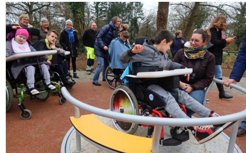
■ Ce tourniquet permet d'installer un fauteuil roulant. Deux bancs sont prévus pour partager le jeu à plusieurs.

Afin de favoriser l'accès aux loisirs pour tous les enfants, quel que soit leur degré d'autonomie, la Ville vient d'installer en décembre une aire de jeux comportant notamment un trampoline et un tourniquet adaptés à l'utilisation en fauteuil roulant.