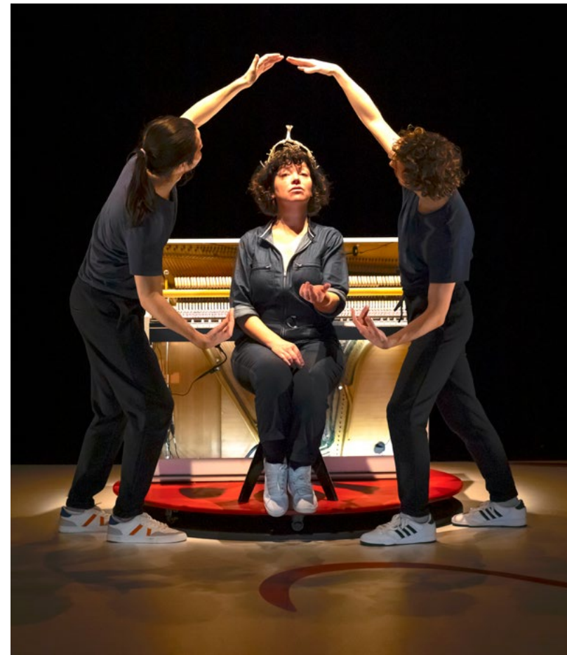
■ "Venise", création de l'artiste rennaise Fanny Chériaux, C* La Volige.