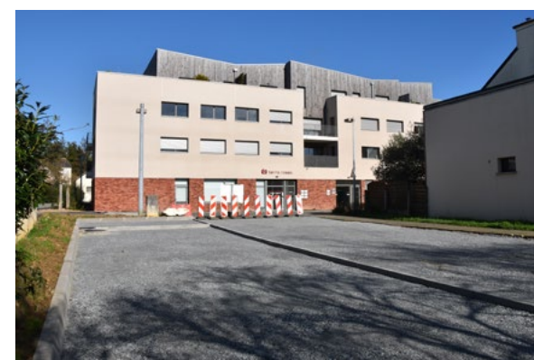
Face au Pôle santé, un parking est en cours de création.

Fraîchement terminés, en cours ou à venir : on fait le point sur les différents travaux dans notre commune. Et comme toujours, faites preuve de prudence aux abords des chantiers !