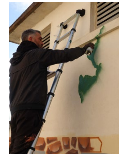
■ Chaque transformateur dispose de son propre thème, imaginé par le collectif La Crèmerie.