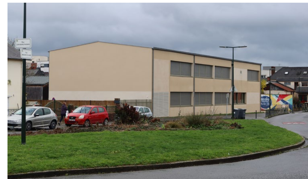
La rue Madame de Janzé accueillera bientôt de nouvelles places de stationnement.