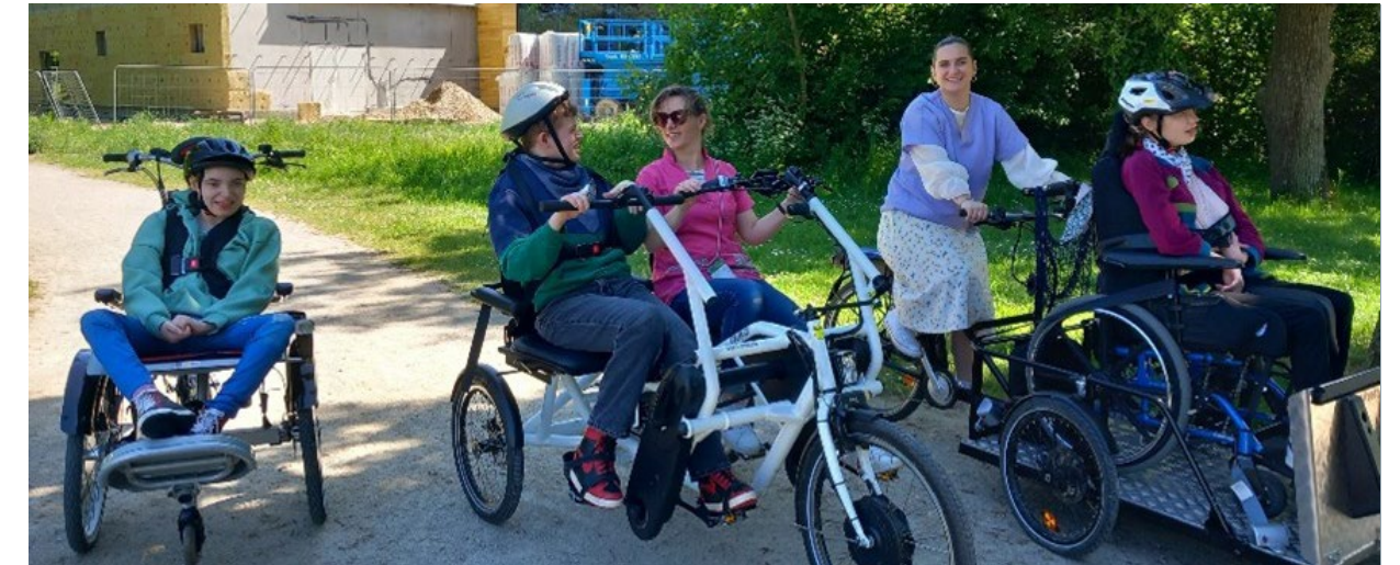
■ Les balades à vélo apportent beaucoup d'apaisement aux enfants et adolescent·es polyhandicapés.

Organiser des temps conviviaux, faciliter les échanges entre familles ou encore récolter des fonds : l'association constituée par les familles dont les enfants sont accueillis au Pôle Elisabeth Zucman joue un rôle essentiel pour appuyer les actions de l'établissement.