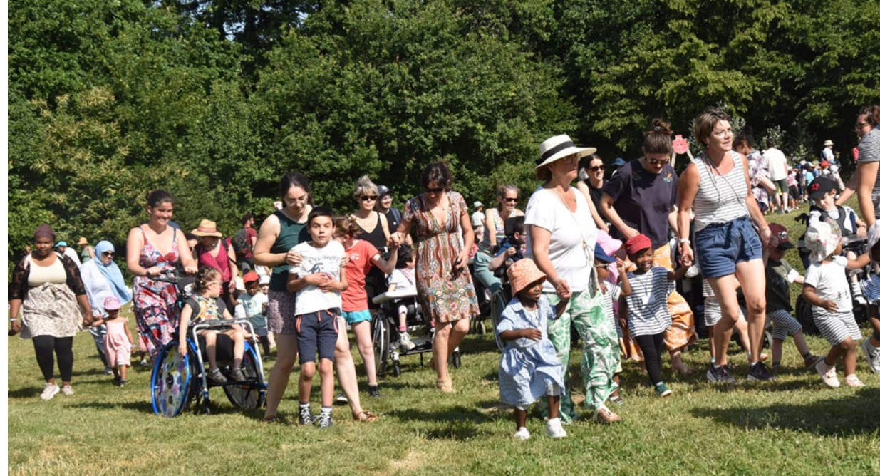
■ 1, 2, 3 Soleil géant lors de la Fête du Fleurissement au Parc de Loisirs en juin 2025.

Le Pôle enfance multiplie les partenariats au sein de la commune pour offrir un large panel d'activités aux 61 enfants et jeunes polyhandicapés qui y sont accompagnés. Ces collaborations permettent aux jeunes de participer à la vie locale et contribuent à leur reconnaissance en tant que citoyen·nes à part entière.