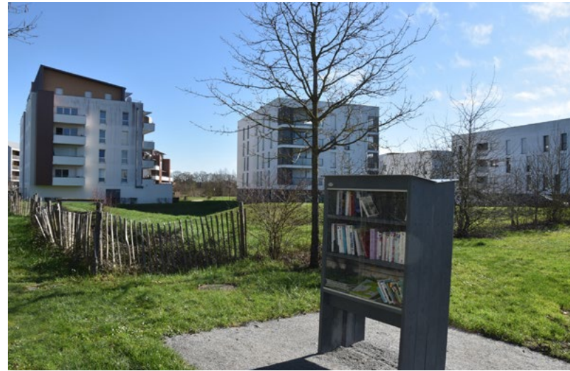
Le kiosque des Peupliers installé à l'entrée du quartier des Portes de la Seiche.

Grâce à l'appui d'un collectif investi, une deuxième boîte à livres a été installée à proximité du cimetière des Peupliers, au sud de la ville. Elle complète celle déjà installée devant la mairie. N'hésitez pas lors de vos promenades à piocher quelques nouvelles lectures !