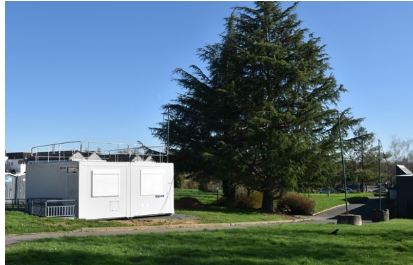
■ Près de l'espace de La Marionnaise, les modulaires installés sont ouverts à la location.